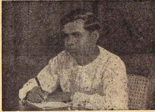
கௌரவ ஆசிரியர்: மு. க. சுப்பிரமணியம்