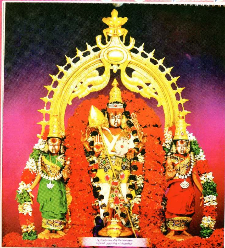
அருள்மிகு வட ஆற்காடு சோலைமலை அருள்மிகு சுப்பிரமணியர்