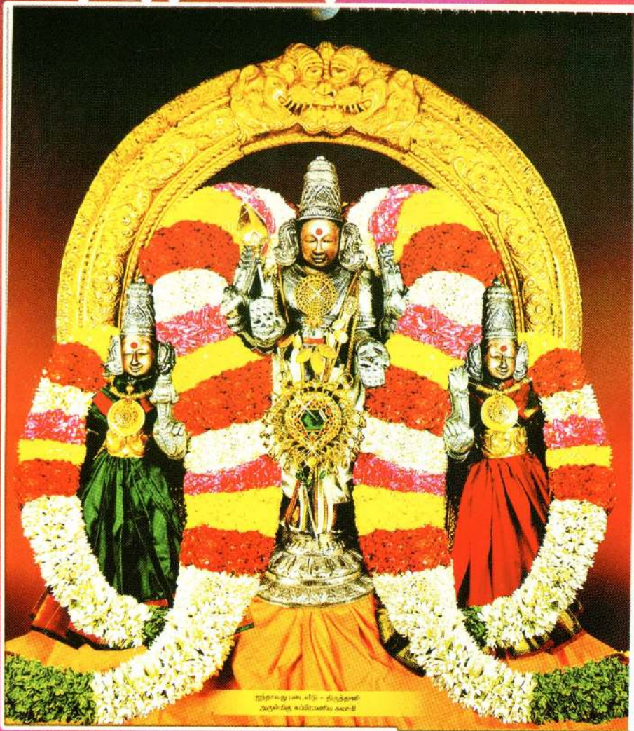
திருத்தணி சுப்பிரமணிய சுவாமி சுப்பிரமணிய சுவாமி சுவாமி