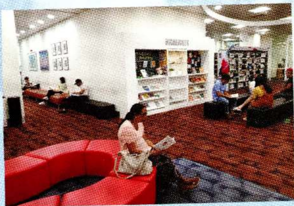
சிங்கப்பூர் - 2020