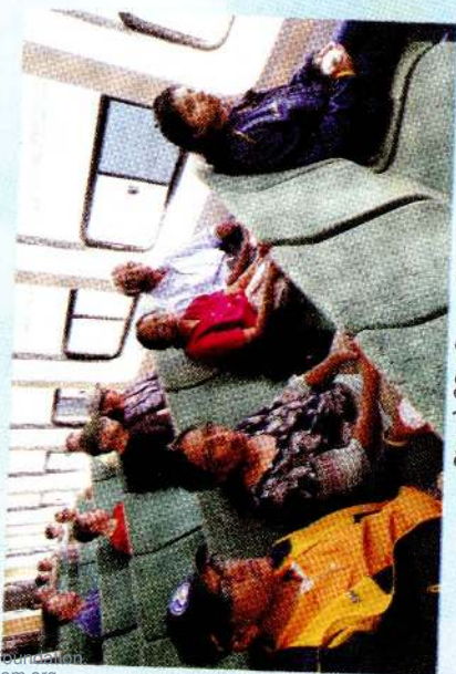
அவுஸ்திரேலியா - 2020