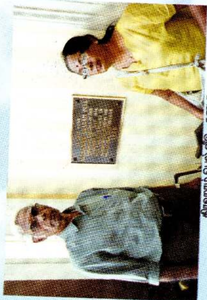
கிறிஸ்தம் பெல் வீடு - கனடா