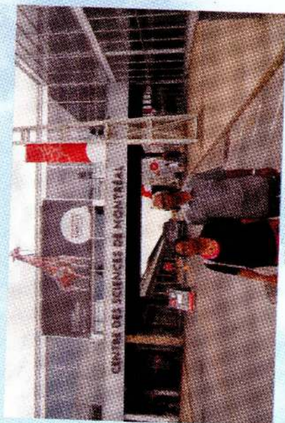
கனடா - 2016