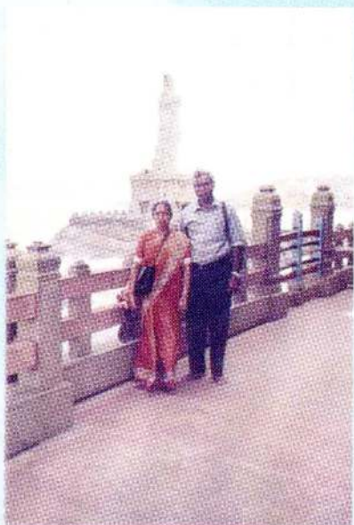
கொழும்பு - 2020