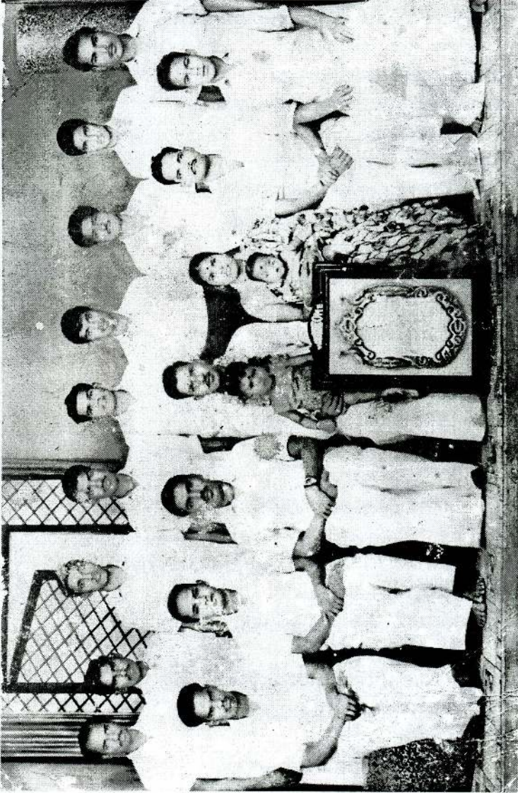
மந்துவில் கிராம அலுவலர் பிரிவிலிருந்து இடமாற்றம் பெற்றுச் செல்லும்போது மந்துவில் பாரதி மன்றத்தினரால் ஏற்பாடு செய்யப்பட்ட பிரிவுசார விழாவின்போது...