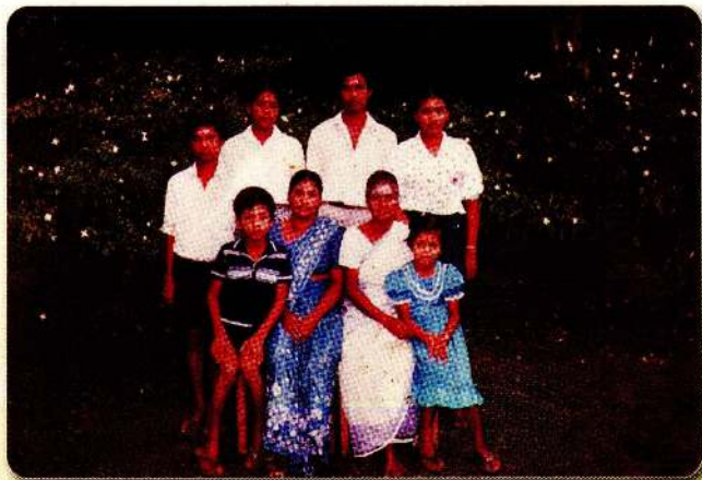
அம்மம்மா, அம்மாவுடன் நாங்கள்