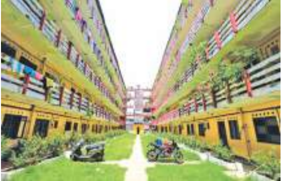
உயன, மெத்சர உயன, லக்முத்து செவன, சிறிமுத்து உயன ஆகிய திட்டங்களை மையப்படுத்தி உரிமைப் பத்திரங்கள் வழங்கப்படவுள்ளன. நகர அபிவிருத்தி அதிகார சபையினால் வழங்கப்

அடுக்குமாடி குடியிருப்பாளர்களுக்கு வீட்டுரிமைப் பத்திரம் வழங்கும் திட்டத்தின் கீழ், 8000 பேருக்கு உரிமைப்பத்திரங்கள் வழங்கப் பட்டவுள்ளன. நகர அபிவிருத்தி அதிகார சபைக்குட்பட்ட 8,000 அடுக்குமாடி குடியிருப்புகளுக்கு இந்த உறுதிப்பத்திரங்கள் ஜூலை மாதம் வழங்கப்படுமென, நகர அபிவிருத்தி மற்றும் வீடமைப்பு அமைச்சர் பிரசன்ன ரணதுங்க தெரிவித்துள்ளார். இது தவிர தேசிய வீடமைப்பு அபிவிருத்தி அதிகாரசபை 1,070 உறுதிப் பத்திரங்களை வழங்கவும் திட்டமிட்டுள்ளது. கடந்த வரவு செலவுத் திட்டத்தில் 50,000 கொழும்பு அடுக்குமாடி குடியிருப்பு உரிமையாளர்களுக்கு வீட்டு உரிமைப் பத்திரங்கள் வழங்கப்படும் என ஜனாதிபதி ரணில் விக்கிரமசிங்க தெரிவித்திருந்தார். இதன்படி இந்த உரிமைப் பத்திரங்கள் வழங்கப்படுகின்றன.