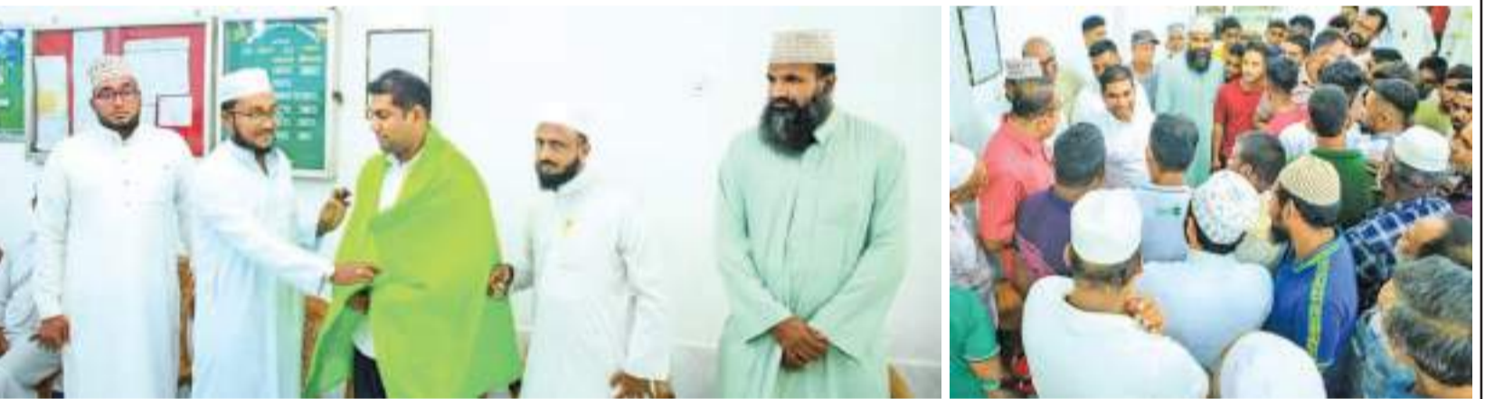
மாத்தறை மாநகர எல்லைக்குட்பட்ட கிராமங்களுக்கு மின்சக்தி அமைச்சர் காஞ்சன விஜேசேகர நேரில் விஜயம் செய்து மக்கள் சந்திப்பில் ஈடுபட்டு வருகிறார். அந்த வகையில் மாத்தறை கடை வீதி பகுதிக்கு விஜயம் செய்த அமைச்சர், அங்கு மொஸலிம்கள், பள்ளிவாசல் நிர்வாகிகள், அரசியல் பிரமுகர்கள் உட்பட பிரதேச மக்களையும் சந்தித்து அளவளாவி போது பிடிக்கப்பட்ட படம்.