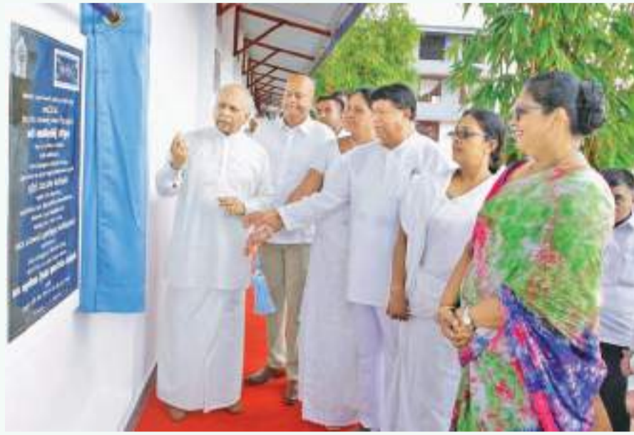
காக முதலீடு செய்யக்கூடிய அளவு, நாடு முழுவதும் கல்வி நிலை சீரற்றதாக எதிர்பார்க்கப்படும் இலக்குகளை விட உள்ளது. எதிர்பார்க்கின்ற இலக்குகளை குறைவாகவே உள்ளது. இதனால்தான் அடைவதில் போட்டி அதிகரித்துள்ளது.

வளங்கள் சமமாக கிடைக்கும் வகையில் கல்வி முறையில் மாற்றத்தை ஏற்படுத்த வேண்டும் என, பிரதமர் தினேஷ் குணவர்தன தெரிவித்துள்ளார். கொட்டாவ ஆனந்த வித்தியாலயத்தின் புதிய மூன்று மாடிக் கட்டடத்தை மாணவர்களிடம் கையளிக்கும் நிகழ்வில் கலந்துகொண்டு, உரையாற்றும் போதே பிரதமர் இவ்வாறு குறிப்பிட்டார். அங்கு மேலும் கருத்துத் தெரிவித்த பிரதமர், புதிய அறிவையும், புதிய தொழில்நுட்பத்தையும் பயன்படுத்துவது இன்றைய மாணவர் தலைமுறைக்கு சவாலாக உள்ளது. அந்த சவாலை நாம் எதிர்கொள்ள வேண்டும். அந்த சவாலின் மூலம், நம் பிள்ளைகள் எதிர்காலத்திற்கு பயனளிக்கக்கூடிய பாடத்தை வலுப்படுத்த வேண்டும். ஒவ்வொரு சாதனையுடனும், எதிர்காலத்தை திட்டமிடும் ஆர்வத்துடனும், கொட்டாவை பிரதேசத்தில் ஒரு பெரிய கல்லூரியாக கொட்டாவ ஆனந்த வித்தியாலயம் விளங்குவது அவசியம். வளங்களுக்கு