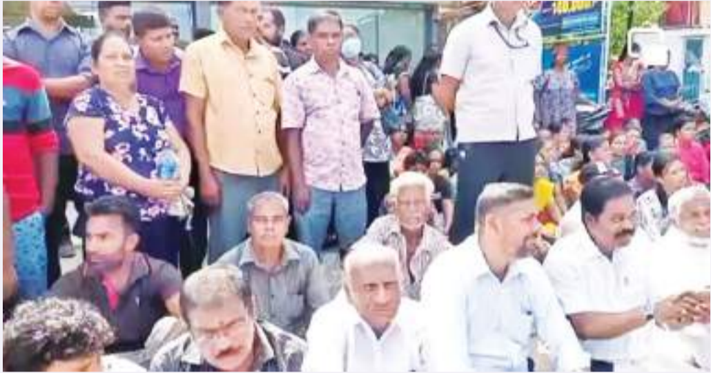
(காணொலி குறும்பு நிருபர்)

கல்முனை வடக்கு பிரதேச செயலகத்துக்கு எதிராக இடம்பெற்று வரும் சூழ்ச்சிகள் மற்றும் நிர்வாக அடக்கு முறைகளை கண்டித்து நேற்று (24) நிழ்க்கிழமை பாரிய ஆர்ப்பாட்டம் இடம்பெற்றது.