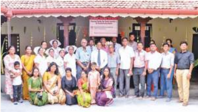
நோயாளர் நலன்புரிச் சங்கம் ஏற்பாடு செய்துள்ளது. இதற்கான நிதி அனுசரணை The Saivite Tamil Foundation, USA அமைப்பு வழங்கி செயல்படுத்துகிறது.

சிவசி இல்லம் தொடர்பில் யாழ். போதனா வைத்தியசாலை நிர்வாகம் தெரிவிக்கையில், நோயாளிகளை யாழ் போதனா வைத்திய சாலை விடுதிகளில் வைத்திருக்கும் நாட்களில் ஓய்வெடுக்க படுக்கை அறைகள், குளிப்பறைகள் உள்ளடங்கலாக வசதிகள் செய்யப்பட்டுள்ளது. நோயாளிகளின் உறவினர்களுக்கான சேவை மையம் என்ற பெயரில் குறித்த இல்லம் இல. 76, வைத்தியசாலை வீதியில் (சத்திரச் சந்திக்கு அப்பால்) கடந்த திங்கட்கிழமை பொதுமக்களின் பயன்பாட்டுக்கு திறந்து வைக்கப்பட்டது. இந்த இலவச சேவையை யாழ் போதனா வைத்தியசாலை நோயாளர் நலன்புரிச் சங்கம் ஏற்பாடு செய்துள்ளது.