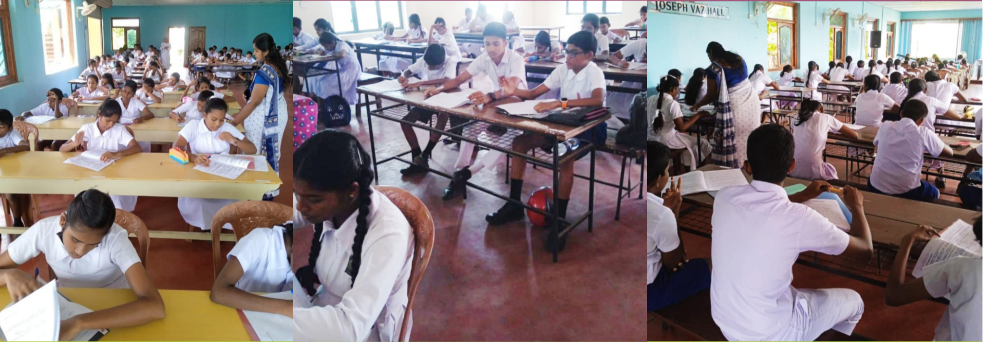
ஞாயிறு மறைப்பாடசாலை மாணவர்களுக்கான தேசியமட்ட திருவிவிலிய அறிவுப்போட்டி மற்றும் கட்டுரைப்போட்டி 30.08.2023 அன்று மறைக்கல்வி நிலையத்தில் நடைபெற்றது. இதில் தமிழ், சிங்களம், ஆங்கிலம் ஆகிய மூன்று பிரிவுகளிலும் மாணவர்கள் கலந்து கொண்டமை குறிப்பிடத்தக்கது.