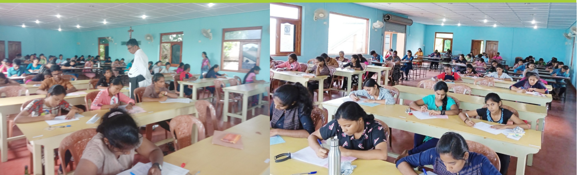
தமிழ் மற்றும் சிங்கள மறையாசிரியர்களுக்கான மறையாசிரியர் தேர்வு 1,2,3 ற்கான பரீட்சை 29.09.2023 அன்று மறைக்கல்வி நிலையத்தில் நடைபெற்றது.