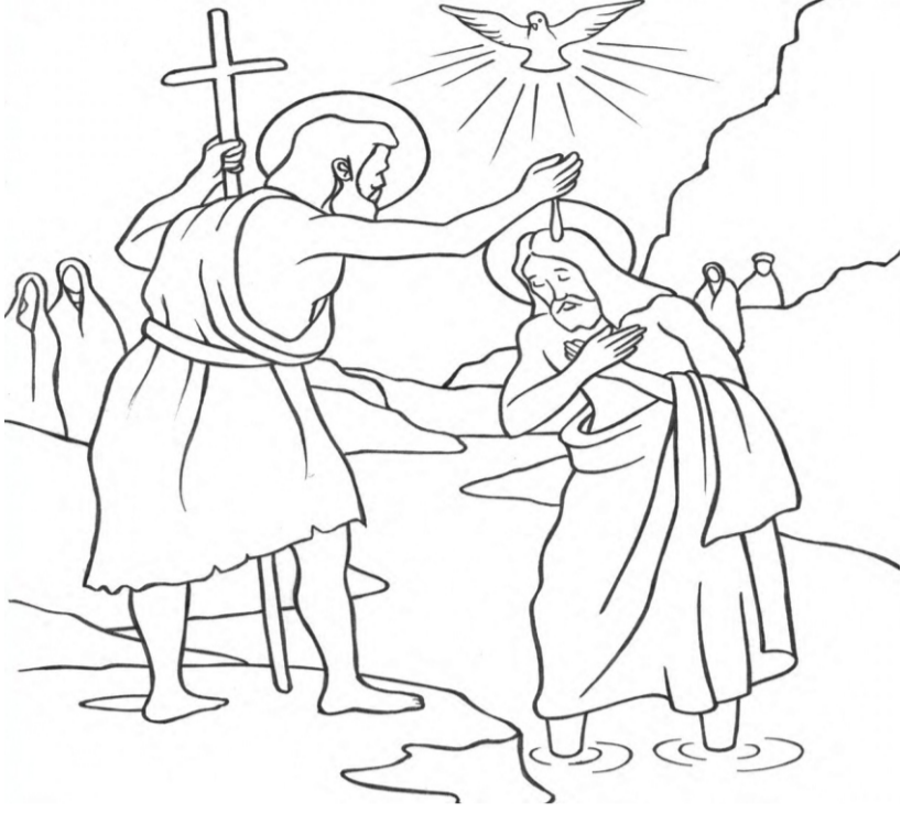
படம் - 01

படத்திலுள்ள 05 வித்தியாசங்களைக் கண்டுபிடித்தலும் நிறம் தீட்டலும்