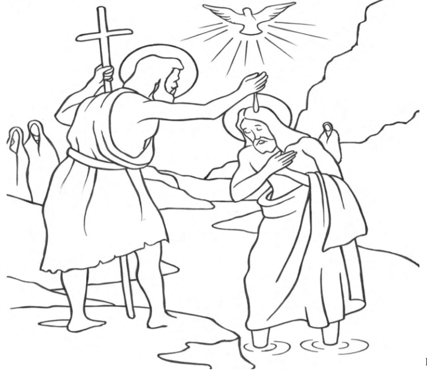
படம் - 02