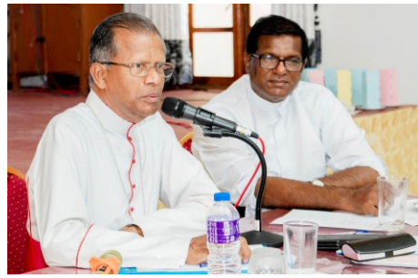
தகவல் அன்பிய இயக்குனர்