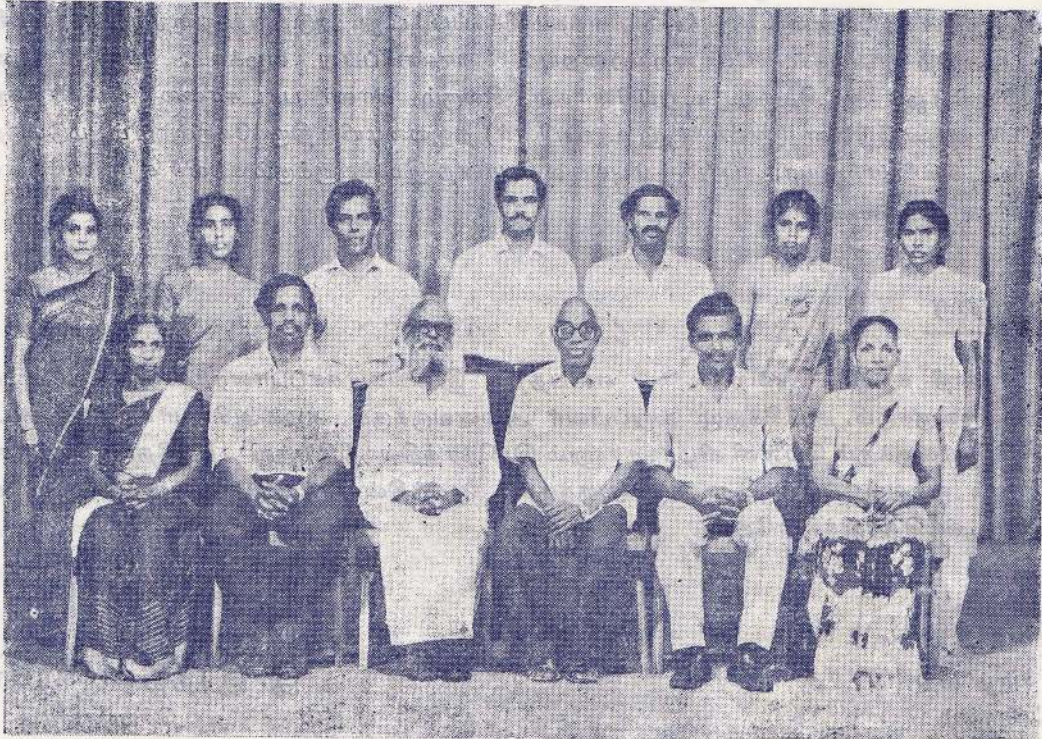
மாண்புமிகு கல்வித் துறை