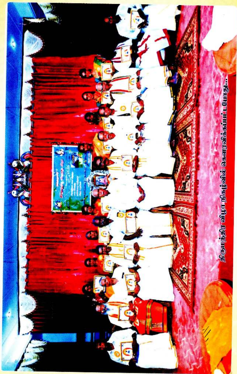
திருமந்திர விழா நிகழ்வில் கௌரவிக்கப்பட்டோரது...