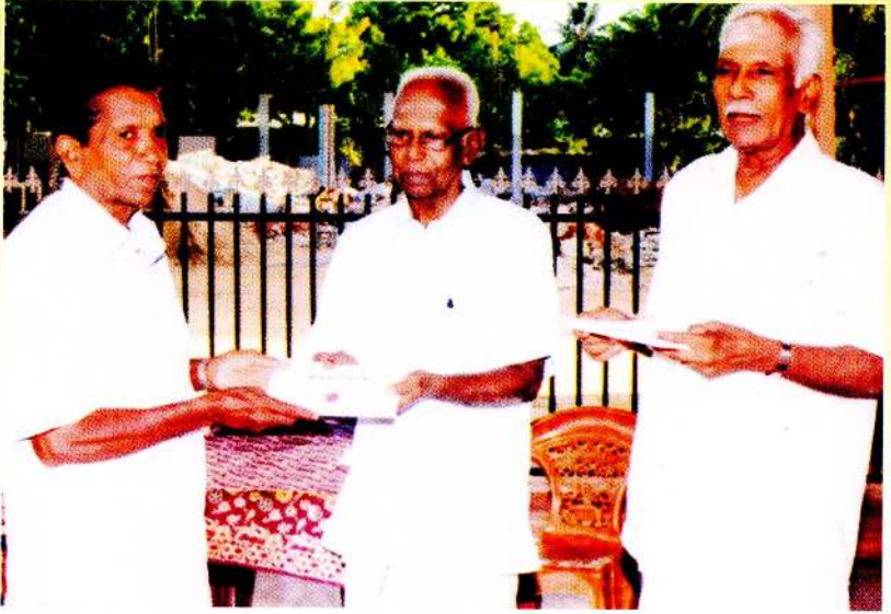
06.09.2015 அன்று சமூகப் பணிக்காக சான்றிதழ் வழங்கிக் கௌரவிக்கப்பட்டபோது