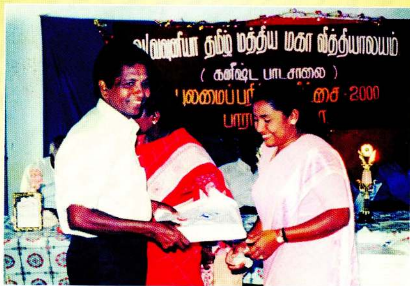
கௌரவ விருந்தினராக வவுனியா மகாவித்தியாலயத்தில் அழைத்தபோது...