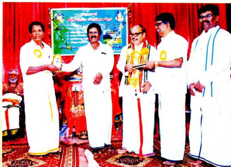
திருமந்திர விழா நிகழ்வில் கௌரவித்து சான்றிதழ் மற்றும் கேடயம் வழங்கிக் கௌரவிக்கப்பட்டபோது...