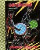
அலெக்சர் பாநதாமன் 400Rs/£4

India 400 Rs London £4 Can/Ame $10 Europe 10 Euro