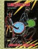
அலெக்சர் பரந்தாமன் 400Rs/£4

India 400 Rs London £4 Can Ame $10 Europe 10 Euro