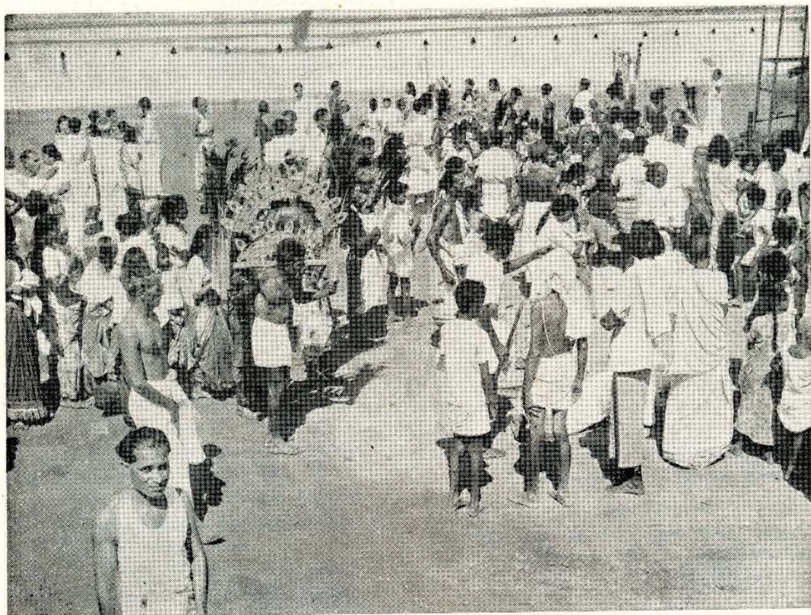
மாணிக்கக் கங்கையில் தீர்த்தமாடிய பின் தங்கள் நேர்த்தியைப் பூர்த்திசெய்யச் சிலர் காவடியெடுக்கின்றனர்.