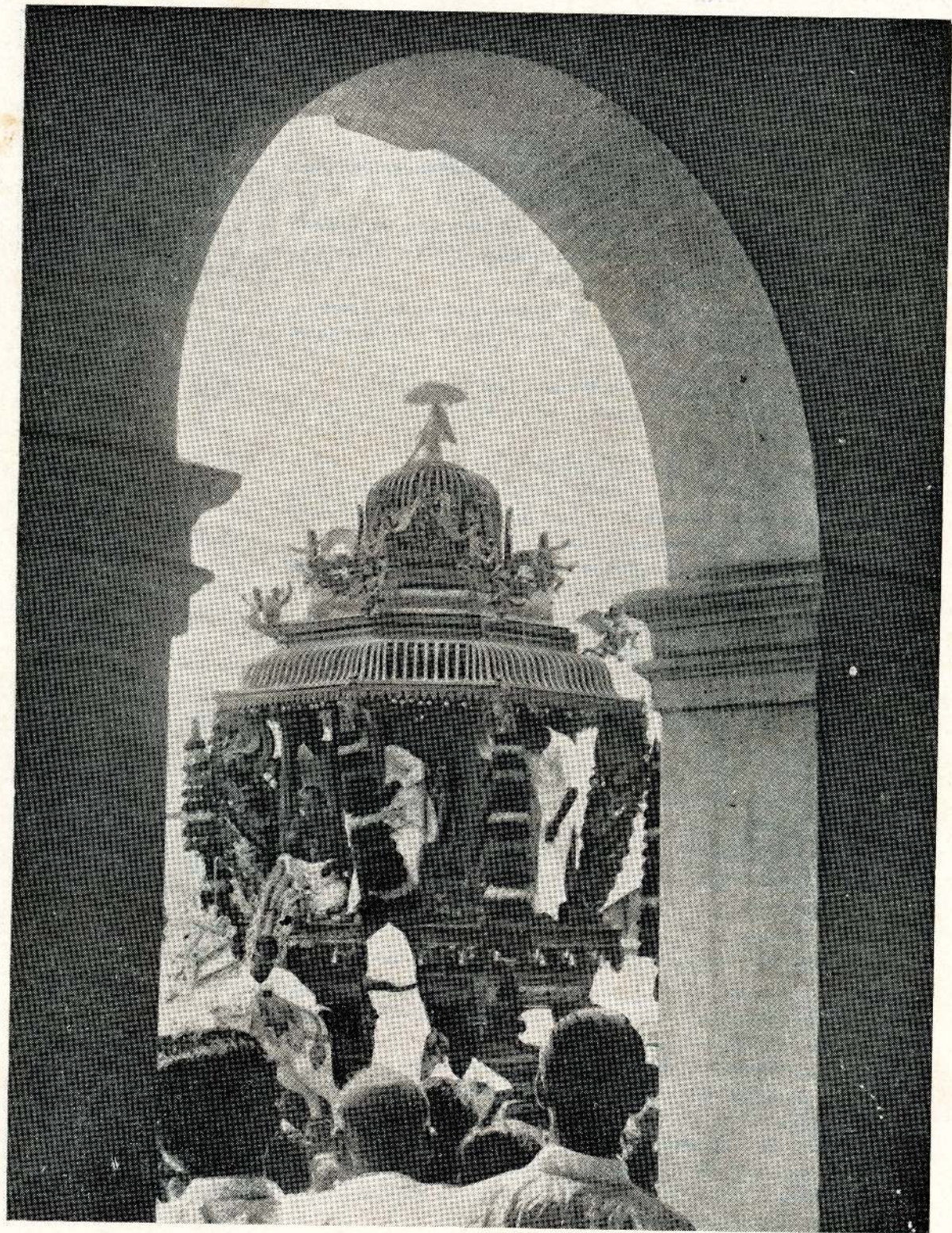
ஆடிவேல் விழா நடைபெற்றபோது சம்மாங்கோட்டார் சுப்பிரமணிய சுவாமி கோயில் இரதம் ஊர்வலமாக வெள்ளவத்தைக்குச் செல்லும் காட்சி.