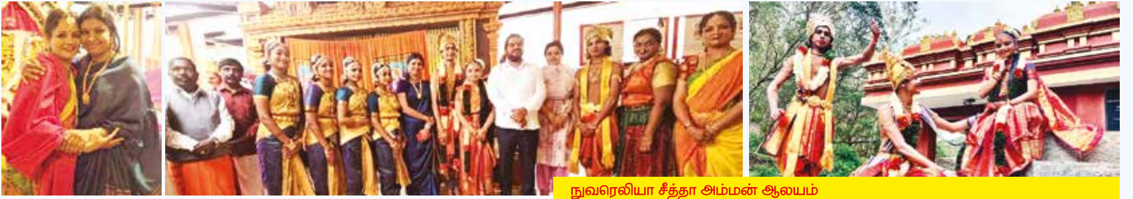
நுவரெலியா சீத்தா அம்மன் ஆலயம்