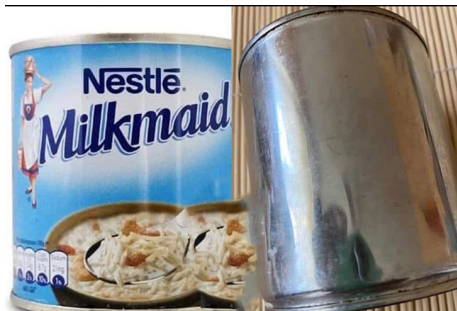
டுகள் மா சீனி எண்டு அயலட்டையுக்கை

முந்தி எங்கட ஊர் சந்தை வழியை அரிசி விக் கிற பெண்டுகள் உந்த சுண்டு கொத்து சேர் மூண்டையும் பாவிச்சுத்தான் அரிசி வியாபாரம் செய்தவை . அவை அரிசி விக் கிற பெண்டுகள் சரியான கண்டிப்பும் சண்டித்தனமும் உள்ள ஆக்கள் எண்ட படியாலை அவைக்கு வாயும் பேசும் குண்டியும் பேசும் எண்டு ஆக்கள் பறையிறவை . தனிய அரிசி மட்டும் எண்டில்லை மன்றத் தானியங்களையும் அளக்க எங்கட ஆக்கள் உந்த சுண்டு கொத்து சேர் மூண்டையும் பாவிச்சவை . இருபத்தி எட்டுக் கொத்து ஒரு புசல் இல்லாட்டில் ஒரு பறை . முந்தி கன கமக்காரர் வீடுகளிலை உந்தப் பறை இருந்தது கண்டியோ எண்டுவா ஆச்சி. எங்கட சாமத்திய வீடுகளிலை நிறை நாழி வைக்கிறதற்கு உந்தக் கொத்தைப் பாவிக்கிறவை எண்ட ஆச்சி கொத்துக்கு நாழி எண்டும் பெயர் எண்டுவா . நிறை நாழி எண்டது மங்கள காரியங்கள் நட கேக்கை மங்கள கரமாக இருக்க வேணும் எண்டுகொத்து நிறையவளை நெல்லை நிரப்பி வைக்கிறது எண்டிற ஆச்சி எங்கட சாமத்திய வீடுகளில உந்த நிரப்பின நெல்லிலை சத்தகத்தைக் குத்தி அதிலை தேசிக்காயும் குத்தி வைப்பினம் எண்டுவா. சில இடங்களிலை கலியாண வீடுகளிலையும் குடி பூரல் வீடுகளிலையும் உப்பிடி நிறைநாழி வைப்பினம் எண்டிற ஆச்சி உப்பிடி நிறை நாழி வைக்கிறது எண்டது அந்தக் காலத்திலையும்