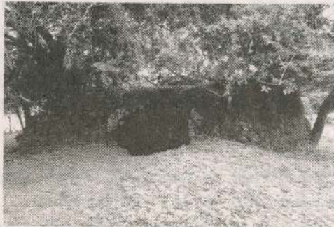
ஒல்லாந்தர் கால காவல் அரண்