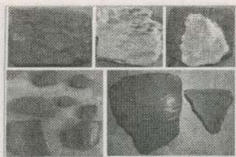
முன்புறம் கட்டி சுருட்டிவிடைய கண்டுபிடிக்கப்பட்ட மடமணல் ஓடுகள்

காட்டுப் பகுதியில் அழிவடைந்த அரண்மனை ஒன்று இருப்பதாகக் கூறப்பட்ட தகவலை அடுத்து அவ்விடத்திற்குச் சென்று தொல்லியல் ஆய்வினை மேற்கொண்டோம்.