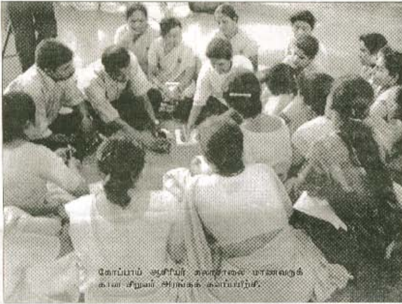
கோப்பாய் ஆசிரியர் அலுவலகம் மாணவருக்கு விட சிறுவர் அரங்கக் கலாப்பயிற்சி.