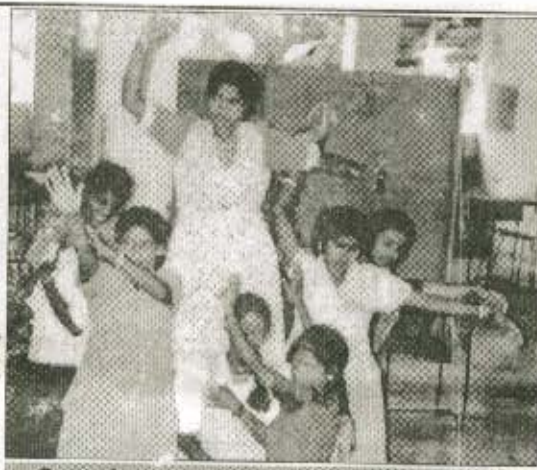
பெண்கள் அரங்கக் களப்பயிற்சி

செயல்திறன் அரங்க இயக்கம் வளமான அரங்கப் பண்பாட்டு வளர்ச்சிக்காக பல்வேறுபட்ட செயற்பாடுகளை நடைமுறைப் படுத்தி வருகின்றது. இதில், நடித்தமிழ் அரங்கில் ஆரம்ப நிலை வளர்ச்சியை அடையாத துறையாக உள்ள பெண்கள் அரங்கத் துறையை விருத்தியடையச் செய்வதற்காக பின்வரும் செயற்பாடுகளைத் தீர்மானித்து நடைமுறைப் படுத்தி வருகின்றது.