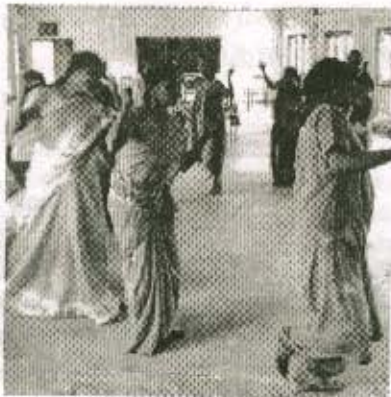
தென்மராட்சி வலய ஆபிரியர்களுக்கான சிறுவர் அரங்க களப்பயிற்சி

(10ஆம் பக்கத் தொடர்ச்சி) தனை. இதனால், களப்பயிற்சியில் பங்கு பற்றும் ஆசிரியர் இரண்டு தள நிலையிலும் தன்னை நிறுத்தவார். சிக்கல்களையும் சமரசமான நிலைமைகளையும் புரிந்து கொள்வார். செயற்படுவதால், பயிற்சியின் முழுச் செயற்பாடுகளையும் அவரால் சிறப்பாக உள்வாங்க முடியும். இந்தப் படிமுறையில் பல ஆசிரியர்கள் தங்களுடம் காணப்பட்ட பயம், சனபக் கூச்சம், பேசுவதில் இருந்த தடங்கல், உணர்வு வெளிப்பாடுத் தடங்கல் என்பன நீங்கியதாகச் சொன்னார்கள். தங்களில் அதிக நம்பிக்கை உடையவர்களாக சிறுவர்களைப் புரிந்து கொள்ளும் மனநிலையைப் பெற்றவர்களாக இருப்பதாக உணர்ந்தார்கள்.