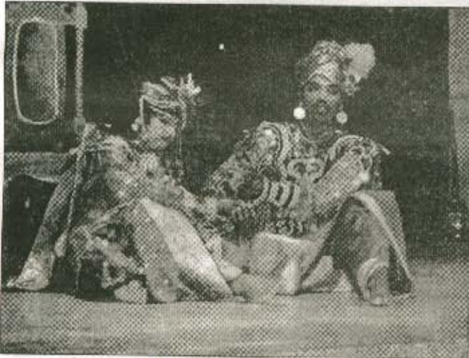
காத்தவராயன் கூத்தில் காத்தான் சின்னான்.

செய்யப்பட்டிருந்தது. அன்றைய நாவற்குழி தெற்குக் கிராமப் பெண்கள் பங்கு பற்றிய 'இராவணேசன்' வடமோடிச் கூத்தம், கைதடி மேற்குக் கிராமப் பெண்கள் பங்கு பற்றிய 'காத்தவராயன்' சிந்துநடைக்கூத்தம் 23.02.2004 அன்று நாவலர் சலாச்சார மண்டபத்தில் மேடையேற்றப்பட்டன. இந்நிகழ்வை செயல்திறன் அரங்க இயக்கத்தின் ஒழுங்கு செய்திருந்தனர்.