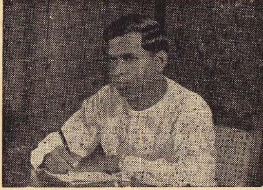
கௌரவ ஆசிரியர்: மு. க. சுப்பிரமணியம்