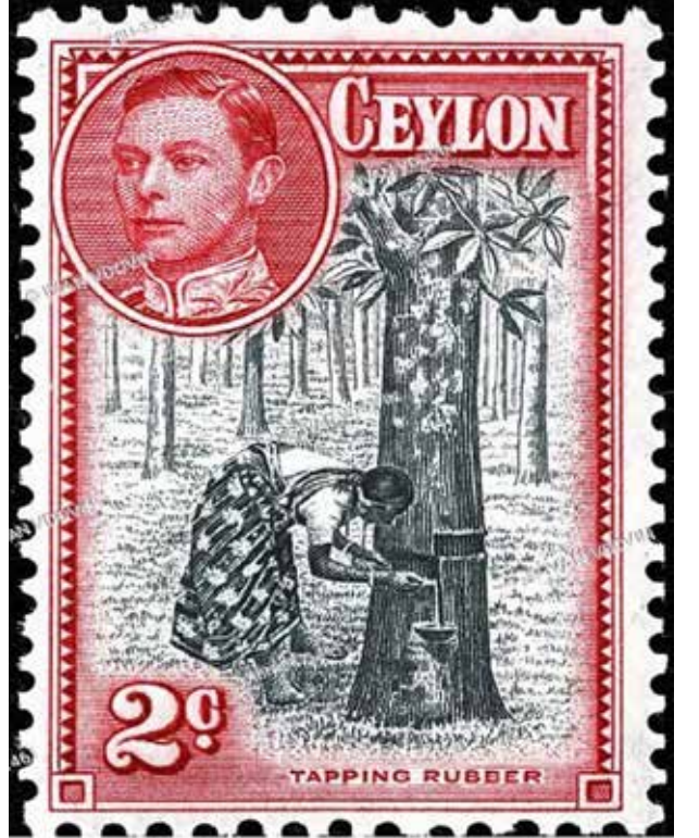
© IVAN VDOVIN/AGEFOTOSTOCK X8N-3371461 - agefotostock

உலக சுகாதார நிறுவனத்தைப் போன்று உலக தொழிலாளர் அமைப்பின் சிபாரிசுகள் மற்றும் வழிகாட்டுதல்களுக்கமைவாகவே இயங்குவதாக இந்நாட்டில் றப்பர் உற்பத்தியில்