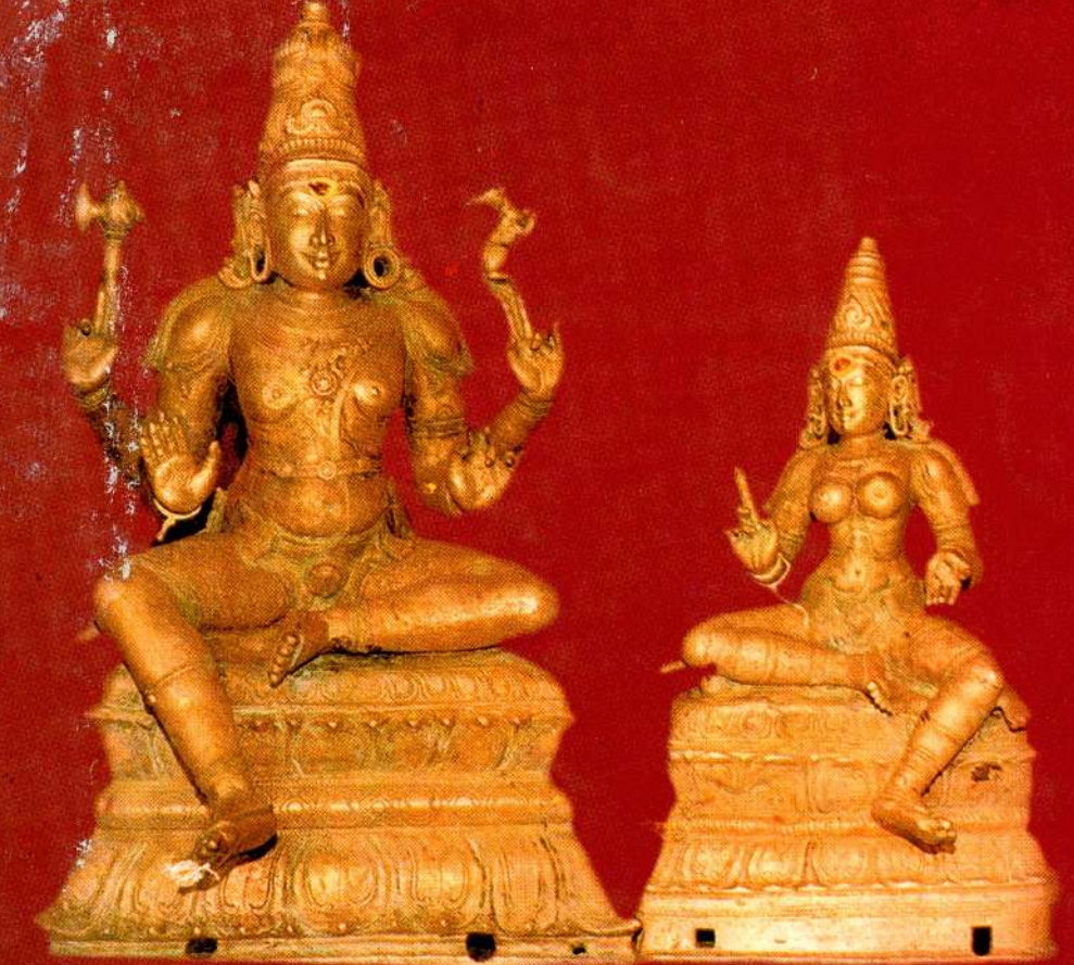
மாதுமையம்பாள் சமேத திருக்கோணநாயகர்