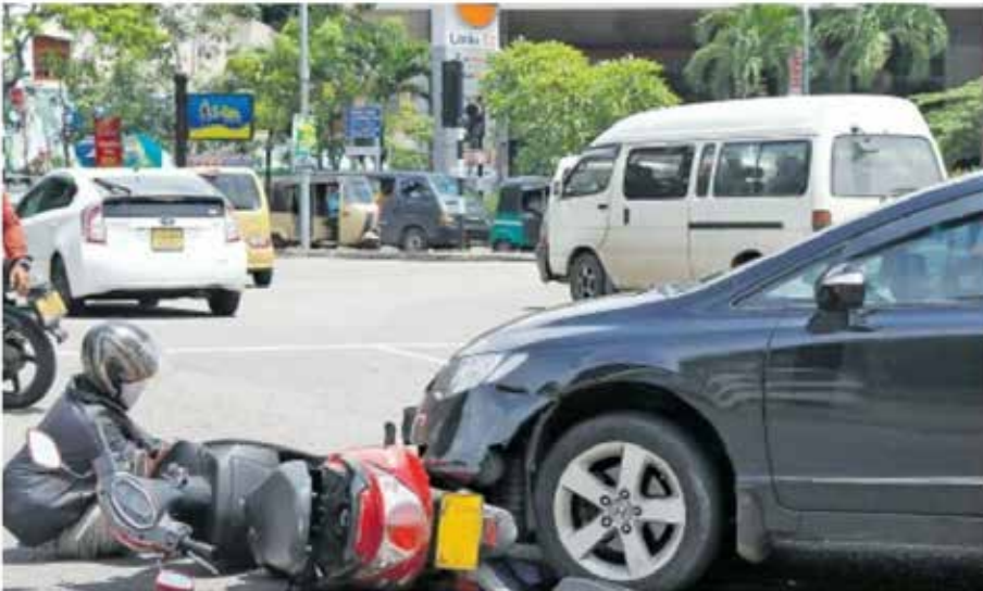
A motorcycle-car collision in Colombo.

01. சாரதி அனுமதிப்பத்திரம் வழங்கும் முறைமையில் மிகவும் நேர்மையான இறுக்கமான நடைமுறைகளைப் பின்பற்றுதல். மாவட்ட மட்டத்தில் சாரதி அனுமதிப்பத்திரம் வழங்க அனுமதிக்கப்பட்டவர்களிலிருந்து எழுமறாகத் தெரிவு செய்யப்படுபவர்களை வேறு ஒரு பரீட்சகர் பரிசோதிக்க வழி செய்தல்.