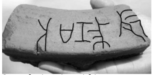
கேரளாவிலுள்ள பட்டாணத்தில் கண்டெடுக்கப்பட்ட தமிழ்ப்பிராமி எழுத்துக்கள்

இலிருந்து கி.பி 10 வரையிலான காலப்பகுதியில் தோற்றம் பெற்றது. இவ்வட்டெழுத்து முறையே தமிழ், தெலுங்கு, மலையாளம், கன்னடம், சிங்களம் போன்றவற்றிற்கு முன்னோடியாக இருந்தது என்று சொல்லப்படுகிறது.