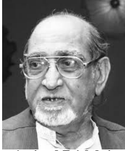
அஸ்கார் அலி இஞ்சினியர்

இந்தியாவின் புகழ்பெற்ற இஸ்லாமிய அறிஞரான அஸ்கார் அலி இஞ்சினியர் (Asghar Ali Engineer) மே 14, 2013 அன்று மும்பை நகரில் தமது 73ஆவது வயதில் காலமாகிவிட்டார். அவரது மறைவு குறிப்பாக இஸ்லாமிய