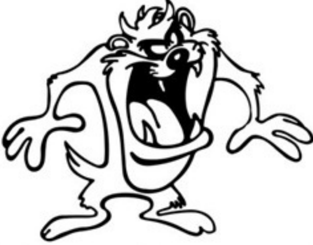
நான் எப்போது தலைவராவது?