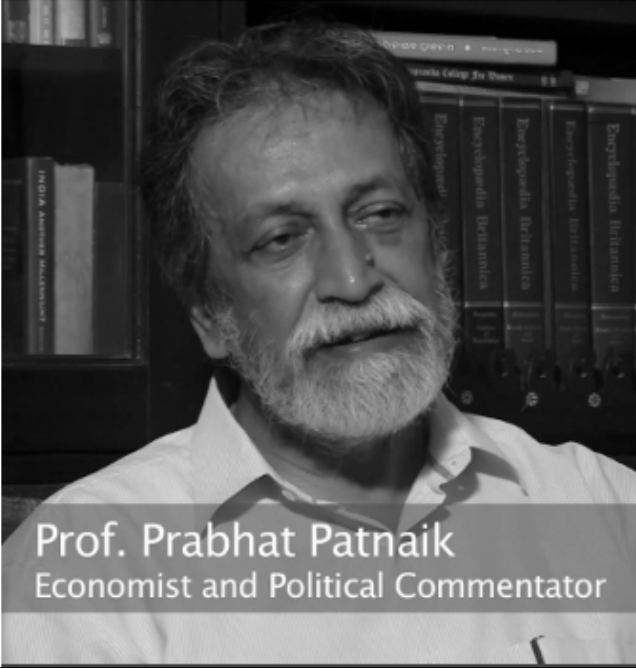
Prof. Prabhat Patnaik Economist and Political Commentator

அழைக்கின்றனர். (பொருள் சுழற்சி தேக்கநிலை என்றால், சந்தை அடிப்படையிலான பொருளாதாரத்தில் பொருளாதார வளர்ச்சி மிகக் குறைவாக இருக்கும் நிலை அல்லது பொருளாதார வளர்ச்சியே இல்லாத நிலை, கிராக்கி இல்லாத நிலை.) இந்தச் சூழலில் இருந்து மீட்சி பெற பழைய சர்வதேச அமைப்புகள் மட்டும் போதுமானதல்ல. மேலும் ஏகாதிபத்திய நாடுகளால், அந்த பழைய அமைப்புகளை புதிய பொருளாதார சூழலுக்கேற்ற வகையில் மாற்றியமைக்கவோ அல்லது புதிய நிறுவன ஏற்பாடுகளை செய்யவோ முடியவில்லை. மாறாக, பிரிக்ஸ், இந்த வகையில் பல புதிய உறுதிமொழிகளை எடுத்துள்ளது. நெருக்கடியைச் சமாளிப்பதற்கான ஏகாதிபத்திய ஏற்பாட்டின் மீதான நம்பிக்கையின்மையின் வெளிப்பாடுதான் 40 நாடுகள் பிரிக்ஸில் இணைய விருப்பம் தெரிவிக்கக் காரணம்.