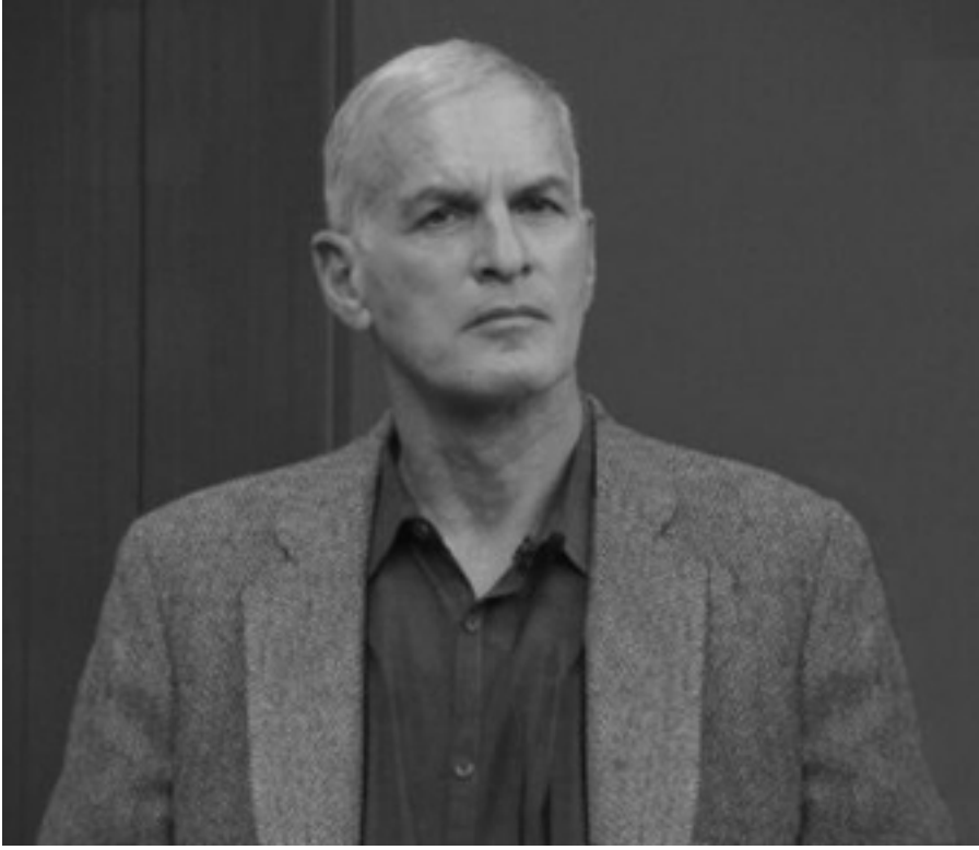
Norman Gary Finkelstein

மக்களுக்கான உணவு தண்ணீர் மின்சாரம் எரிபொருள் என்பவற்றை மறுப்பதன் மூலம் அதை இஸ்ரேல் செய்யப் போவதாக அறிவித்திருக்கிறது. அப்படியாயின் நீங்கள் காஸா மக்களின் மீதான கூட்டுப்படுகொலையை ஆதரிக்கிறீர்களா? அதாவது நீங்கள் இஸ்ரேலுக்கு செங்கம்பள வரவேற்பை அளிப்பது என்பது பலஸ்தீன மக்களின் மீதான கூட்டுப் படுகொலைக்கு செங்கம்பளம் விரிப்பதாகும். நீங்கள் உங்கள் வேலைகளுக்கு பொறுப்புள்ளவர்களாக இருங்கள்.