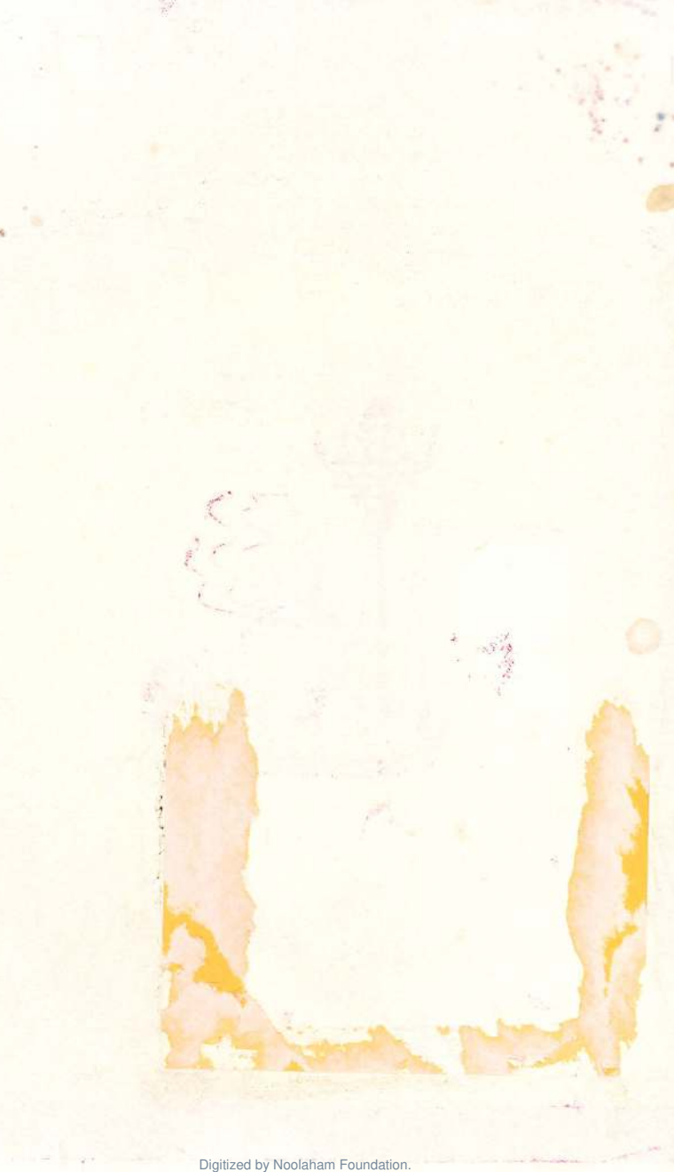
Digitized by Noolaham Foundation. noolaham.org | aavanaham.org