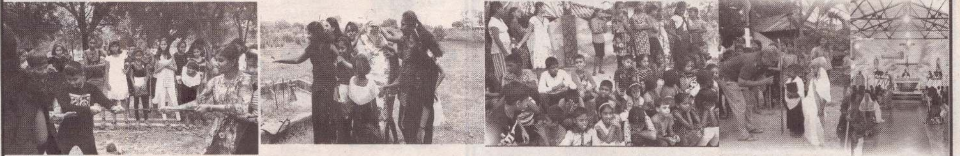
புனித மரியாள் பேராலயம்