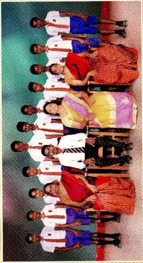
கவிள் கலை மலர்ம்