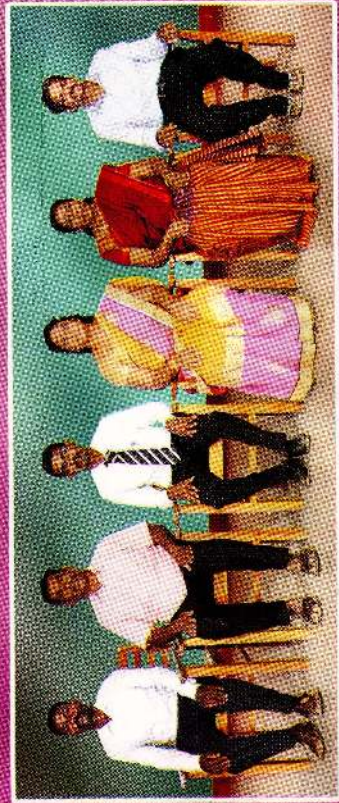
Non - Academic Staffs