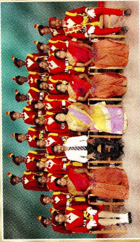
பாஸ்ட் வாத்தியக் குழு