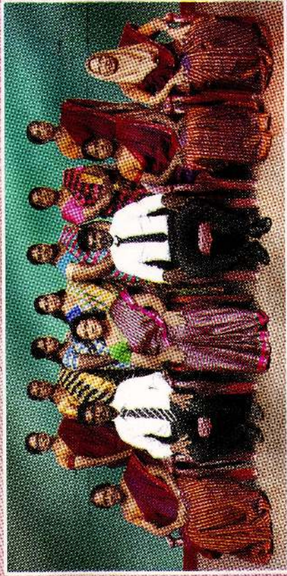
School Development Committee