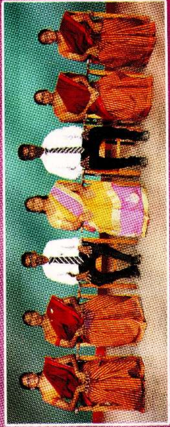
Sustainable Development Committee