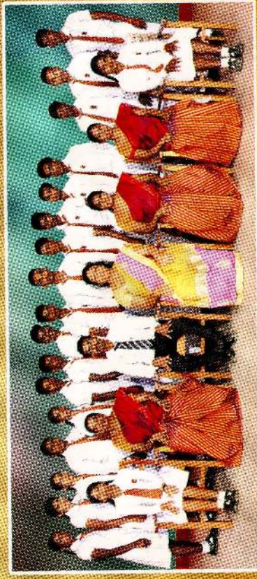
க.வொ.த உயர்தர மன்றம்