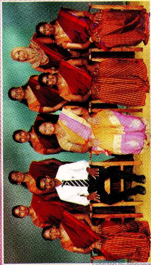
School Management Committee