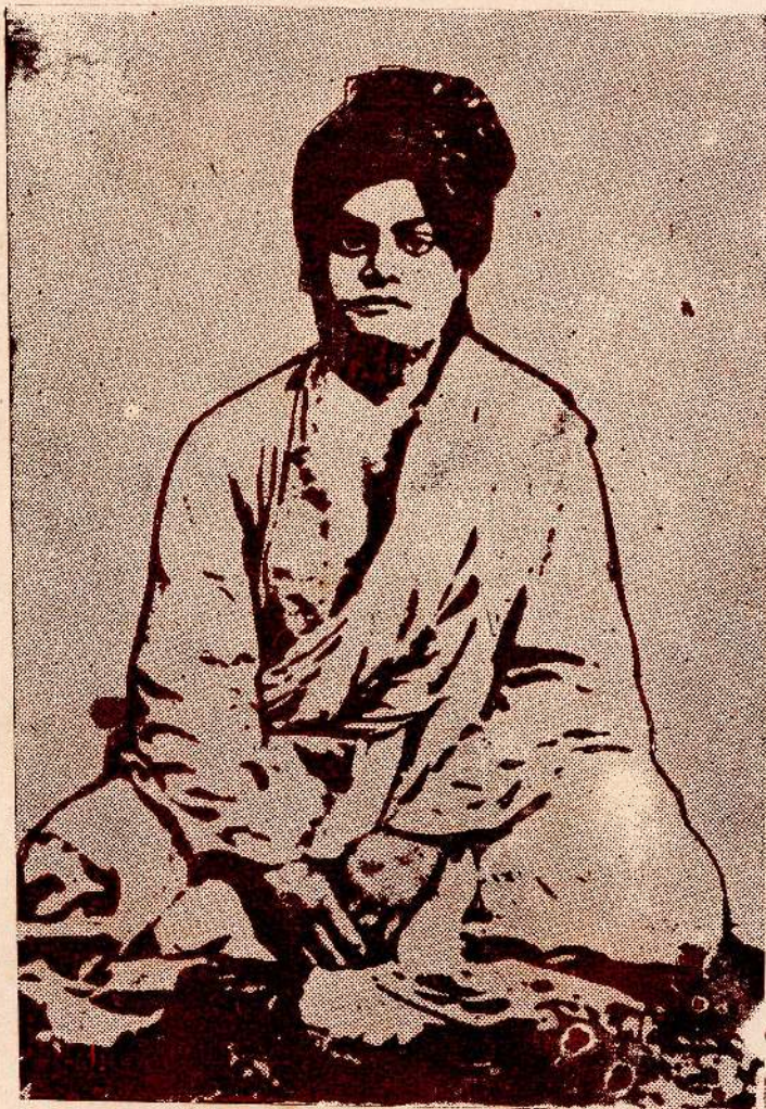
கொழும்பில் சுவாமி விவேகானந்தர் — ஜனவரி 1897