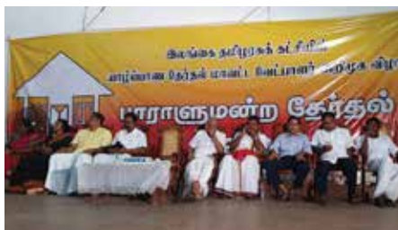
அறிமுக நிகழ்வு தந்தை செல்வா அரங்கு கொள்ளாத மக்கள் கூட்டத்துடன்