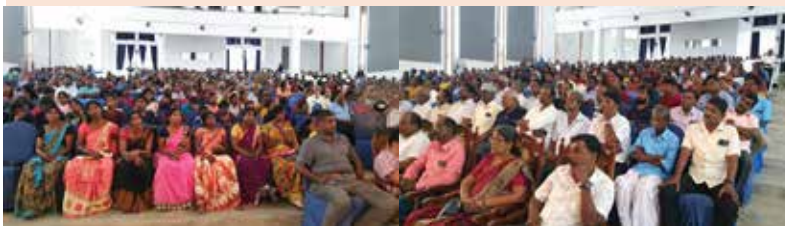
இலங்கைத் தமிழ் அரசுக் கட்சியின் யாழ்ப்பாணத்தேர்தல் மாவட்ட வேட்பாளர்