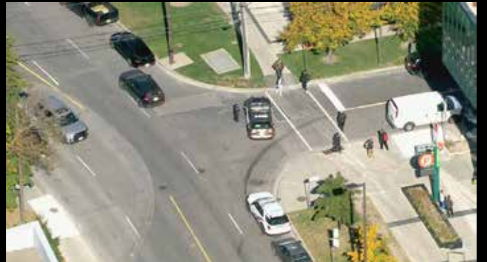
சம்பவம் தொடர்பில் பொலிஸார் விசாரணைகளை ஆரம்பித்துள்ளனர்.