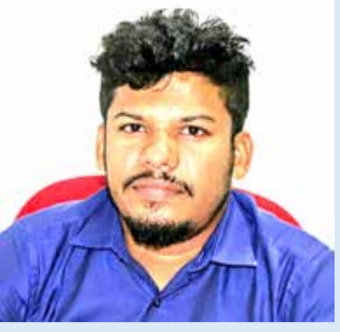
(ஹஸ்பர் ஏ ஹலீம்)