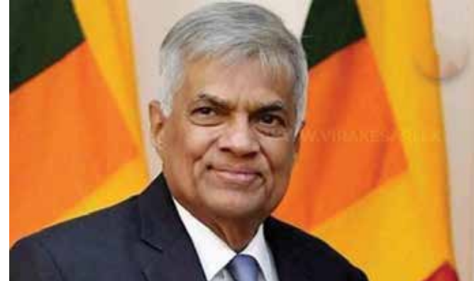
இம்மாதம் 14ஆம் திகதி நடைபெறவுள்ள

பொதுத்தேர்தல் நிறைவடைந்த பின்னர், முன்னாள் ஜனாதிபதி ரணில் விக்கிரமசிங்க, விடுமுறைக்காக தான் வெளிநாட்டுக்கு பயணிக்க வுள்ளதாக தெரிவித்துள்ளார்.