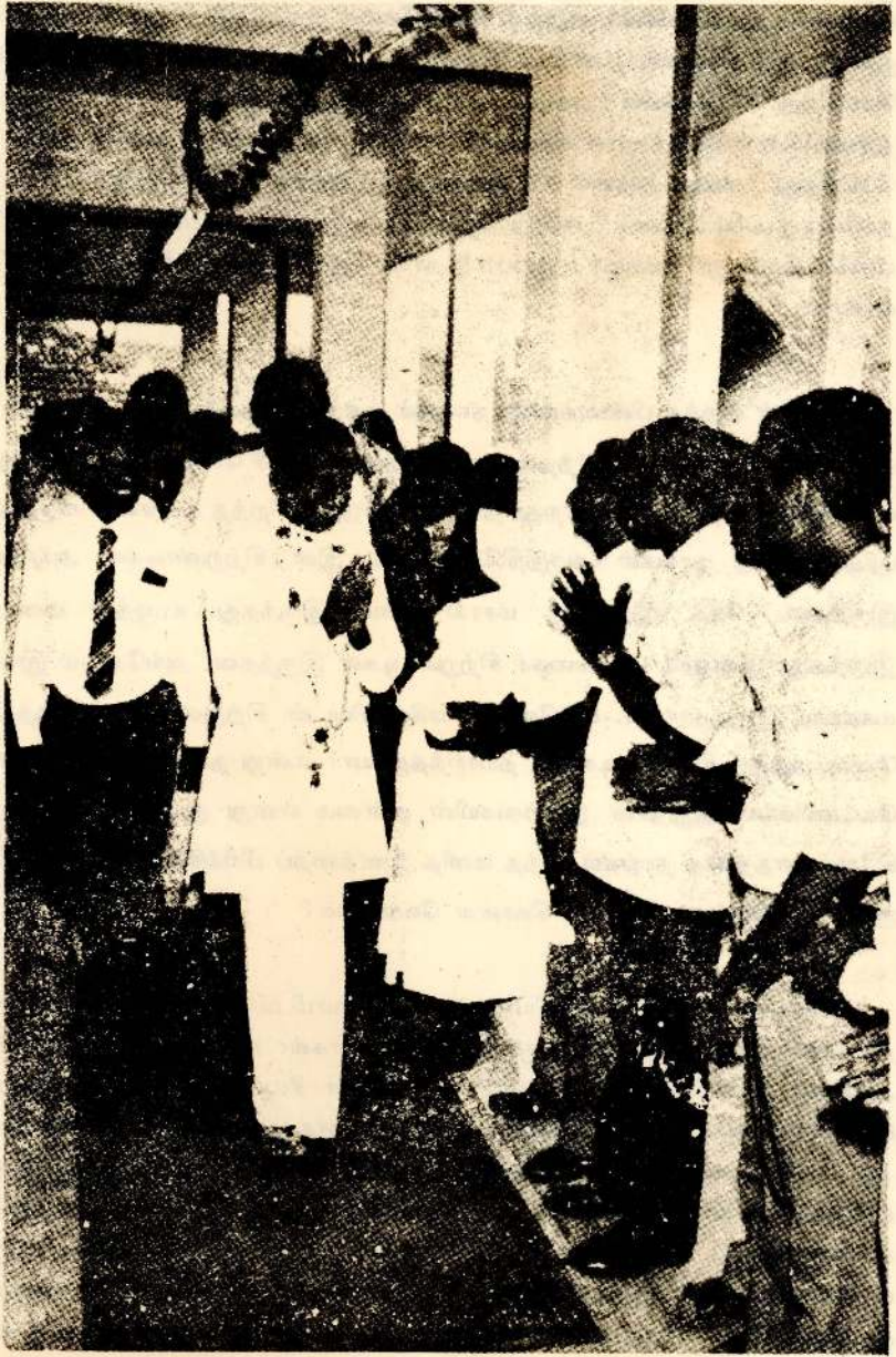
கொழும்பு விவேகானந்த மகா வித்தியாலயத்திற்கு வருகை தந்த கௌரவ பிரதம மந்திரி அவர்களை வரவேற்றல்