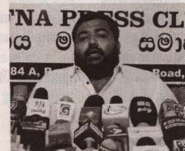
மக்கள் சந்திப்பில் இவர் இவ்வாறு கேள்வியெழுப்பினார்.

தமிழ் தேசியத்துக்காக வாக்குளியுங்கள் என்பவர்கள் ஏன் பல துண்டுகளாக பிரிந்து நிற்க வேண்டும்? தலைவரையே ஏமாற்றிய இவர்களா தமிழ்த் தேசியத்தை காப்பாற்றுவார்கள்? எனவும் அவர் குறிப்பிட்டார். நாவற்குழியில் இடம்பெற்ற