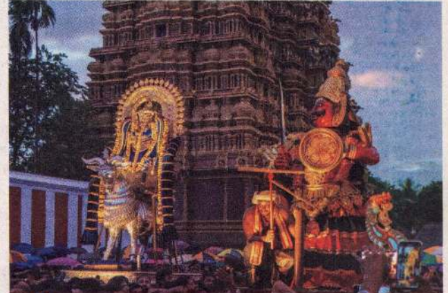
கந்தசஷ்டியின் இறுதிநாளான நேற்று வரலாற்று பிரசித்தி பெற்ற நல்லூர் கந்தசுவாமி ஆலயத்தில் சூரன் போர் இடம் பெற்றவேளை...!