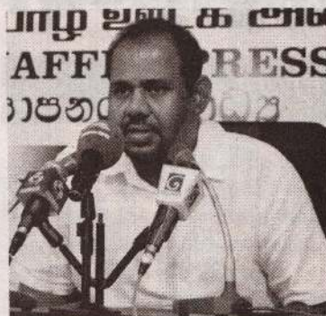
தமிழ்த் தேசிய மக்கள் முன்னணி இம்முறை தேர்தலில் அமோக வெற்றி ஈட்டவேண்டும் எனவும் அவர் குறிப்பிட்டார். (அ)