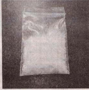
டைத்த விசேட அதிரடிப் படையினர் மேலதிக விசாரணைகளை மேற்கொண்டு வருகின்றனர்.