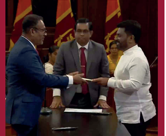
தொழில் அமைச்சராக கலாநிதி அனில் ஜயந்த பெர்னாண்டோ பதவியேற்றுள்ளார்.