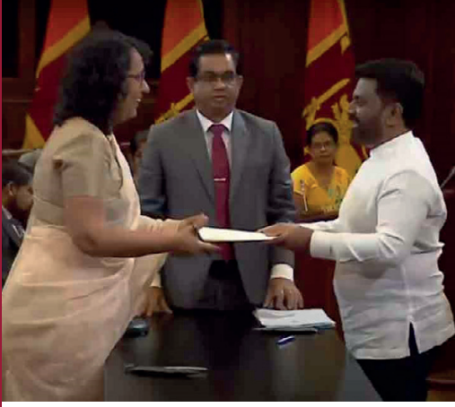
கல்வி, தொழிற்கல்வி மற்றும் உயர் கல்வி அமைச்சராக பிரதமர் ஹரினி அமரகரிய பதவியேற்றுள்ளார்.