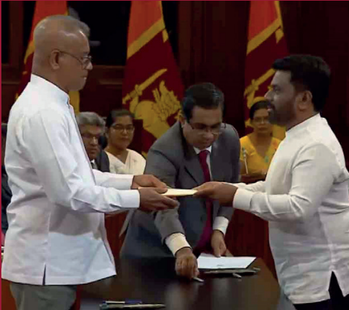
விவசாயம், காணி, கால்நடை மற்றும் நீர்ப்பாசனம் அமைச்சராக லால் காந்த பதவியேற்றுள்ளார்.