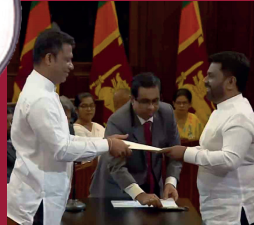
சுகாதாரம் மற்றும் வெகுசன ஊடகத்துறை அமைச்சராக வைத்தியர் நலிந்த ஜயதிஸ்ஸ பதவியேற்றுள்ளார்.