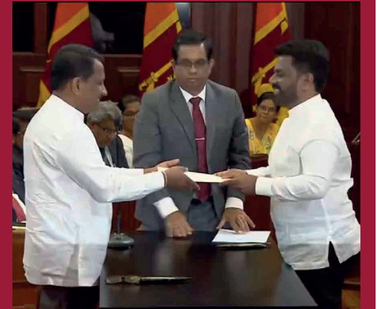
பெருந்தோட்ட மற்றும் சமூக உட்கட்டமைப்பு அமைச்சராக சமந்த வித்யாரத்த பதவியேற்றுள்ளார்.