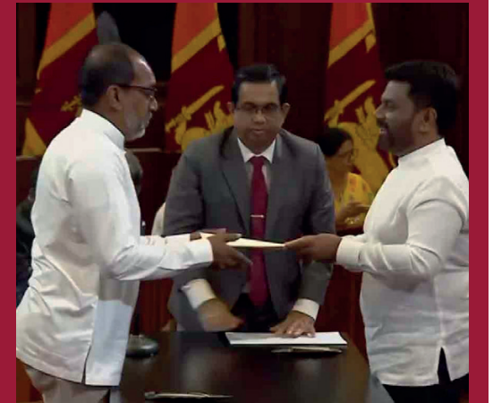
பௌத்த சாசன அமைச்சராக பேராசிரியர் ஹினிதம கனில் செனவி பதவியேற்றுள்ளார்.