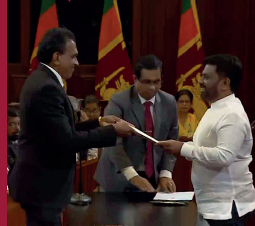
விஞ்ஞானம் மற்றும் தொழில்நுட்ப அமைச்சராக கலாநிதி கிருஷ்ணந்த சில்வா அபேயசேன பதவியேற்றுள்ளார்.