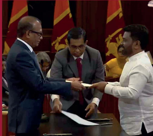
நகர அபிவிருத்தி, நிர்மாணிப்பு மற்றும் வீடமைப்பு அமைச்சராக அநூர கருணாதிலக பதவியேற்றுள்ளார்.