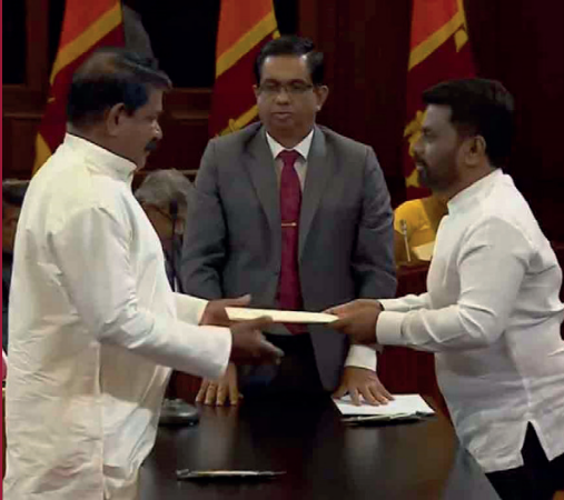
கடற்றொழில் மற்றும் நீரிடயல் கடல் வளங்கள் அமைச்சராக ராமலிங்கம் சந்திரசேகர் பதவியேற்றுள்ளார்.