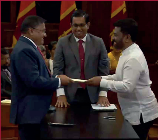
வெளிவகாரம் மற்றும் வெளிநாட்டு வேலைவாங்குபு, சுற்றுலாத்துறை அமைச்சராக விஜித வேரத்த பதவியேற்றுள்ளார்.