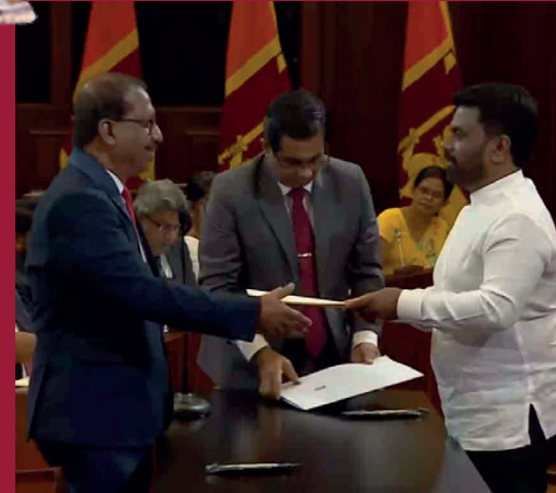
இளைஞர் விவகார மற்றும் விவசாயத்துறை அமைச்சராக கனில் குமார கமகே பதவியேற்றுள்ளார்.