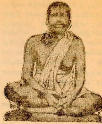
பகவான் ஸ்ரீ ராமகிருஷ்ணர்.

சாயக்காரன் துணிகளுக் குச் சாயமேற்றும் போது மற்றவர்களுக்குத் தெரியாத புதுமையான ஒரு முறையைக் கையாண்டு வந்தான். “உன் துணிக்கு எந்த நிறத்தில் சா யம் தோய்க்க வேண்டும்?” என்று அவன் வாடிக்கைக் காரரைக் கேட்பான். “சிவப்பு நிறம்” என்று வாடிக்கைக் காரர் சொன்னால், உடனே சாயக்காரன் வர்ணக் கலவை உள்ள பாத்திரத்தில் அந்தத்