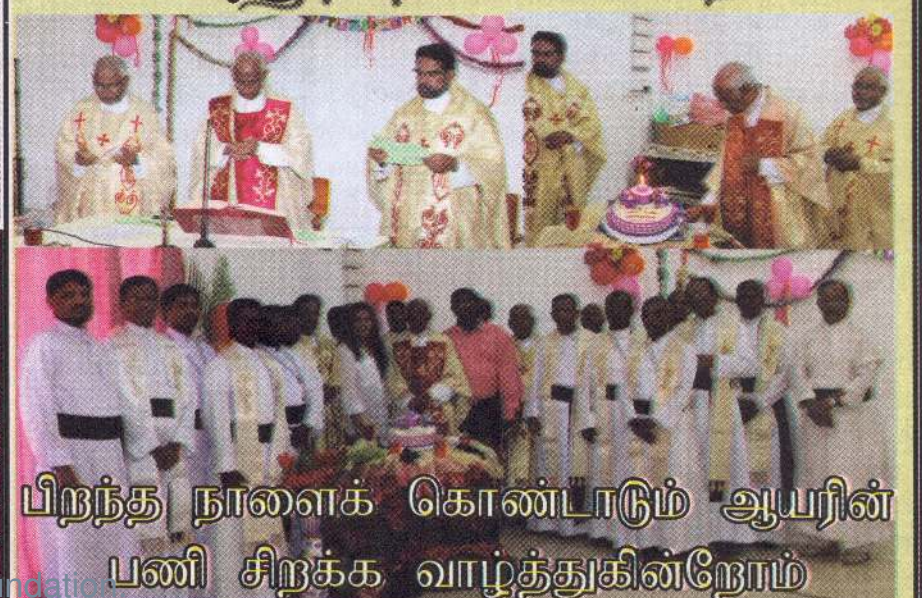
பிறந்த நாளைக் கொண்டாடும் ஆயரின் பணி சிறக்க வாழ்த்துகின்றோம்