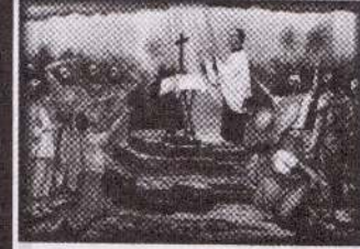
அமைதி மற்றும் இலங்கையின் திருத்தாராக நோக்கப்படும் அருளாளர் ஜோசப்வாஸ் அவர்கள்

அருளாளர் ஜோசப்வாஸ் புனிதராக அறிவிக்கப்படுவது குறித்து அக்களிப்பு