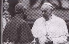
திருத்தந்தை பிரான்சிஸ் அவர்கள் இலங்கைக்கு மேற்கொள்ளும் திருப்பயணத்தில்

அரசியல் நுழைய அனுமதிக்க வேண்டாம் என்று கொழும்பு பேராயர் கர்தினால் மால்கம் ரஞ்சித் அவர்கள் கேட்டுக் கொண்டுள்ளார். 2015ம் ஆண்டு ஜனவரி 13 முதல் 15வரை திருத்தந்தை பிரான்சிஸ் அவர்கள் இலங்கைக்கு மேற்கொள்ளும் திருப்பயணத்தைக் குறித்து செய்தியாளர்களை சந்தித்து பேசிய கர்தினால் ரஞ்சித் அவர்கள் இத் திருப்பயணத்தின் போது தேர்தல் பிரச்சாரம் எதுவும் நடக்காமல் பார்த்துக் கொள்ளுமாறு அரசைக் கேட்டுள்ளதாகவும் கூறினார். இத்திருப்பயணத்தின் போது திருத்தந்தை அவர்கள் இலங்கை அரசுத் தலைவர் மஹிந்த ராஜபக்ஷ அவர்களை மரியாதையின் நிமித்தம் சந்திப்பார் என்றும் திருத்தந்தை மன்னார் மாவட்டத்திற்குச் செல்வார் என்றும் கர்தினால் ரஞ்சித் அவர்கள் அறிவித்துள்ளார். மேலும் இத்திருப்பயணத்தின் போது திருத்தந்தை பிரான்சிஸ் அவர்கள் குண்டு துளைக்காத காரில் செல்ல விரும்பவில்லை எனவும் கர்தினால் ரஞ்சித் அவர்கள் தெரிவித்துள்ளார்.