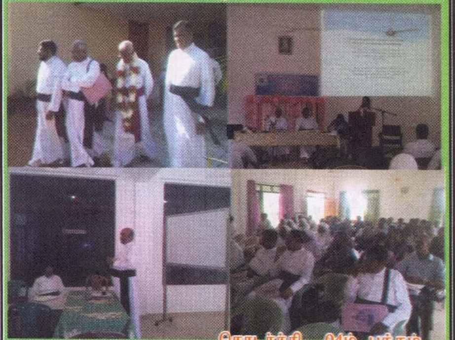
தொடர்ச்சி 04ம் பக்கம்