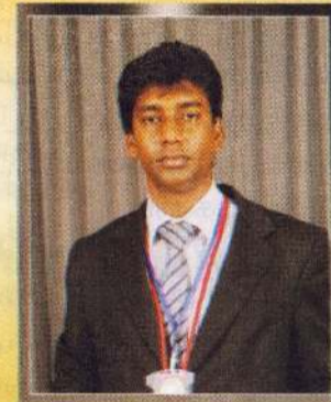
Dr. ஜெ.நொய்சன் செபம்

பிதாவே உம்மை ஆராதிக்கின்றோம் இயேசுவே உம்மைப் போற்றுகின்றோம் தூய ஆவியானவரே உம்மைத் துதிக்கின்றோம் ஜெயரெட்ணம் நொய்சனின் ஆன்மா நிறைவான நித்திய இளைப்பாறுதலை அடையட்டும் ஐயா இவர் இவ்வுலகில் வாழ்ந்த போது செய்த அனைத்துப் பாவங்களையும் கல்வாரி இரத்தத்தால் சுத்திகரித்து ஆன்மாவைப் பரிசுத்தப்படுத்தி நிறைவான நித்திய நிலை வாழ்வைக் கொடுத்து இவரும் உம் புனிதர்களின் கூட்டத்தில் உம்மைப் புகழ்ந்து மகிழ்ச்சி கொள்ள வேண்டுமென்று இயேசுவின் இனிய நாமத்தில் ஜெபிக்கின்றோம் எங்கள் நல்ல பிதாவே ஆமென்