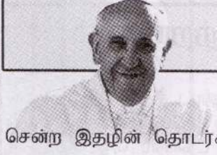
சென்ற இதழின் தொடர்ச்சி..

வேறு எல்லா இடங்களிலும் பார்க்க குடும்பம் ஒன்றில்தான் எங்களதும் மற்றவர்களதும் எல்லைகள் பற்றியும், அடுத்தவரோடு அமைதியாக வாழுகின்றபோது அங்கு பின்னிப் பிணைந்துள்ள பெரியதும் சிறியதுமான பிரச்சினைகளைப் பற்றியும் நாளாந்தம் எம்மால் அனுபவிக்கக் கூடியதாக இருக்கின்றது. குறைகளற்ற குடும்பம் ஒன்று எங்கேயும் கிடையாது. முழுமையின்மை குறித்தோ, பலயினங்கள் குறித்தோ, குழப்பங்கள் மோதல்கள் குறித்தோ நாம் அஞ்சக் கூடாது. அதைவிட, அவற்றை எவ்வாறு ஆக்கபூர்வமாக கையாள முடியும் என்பது குறித்தே கற்றுக் கொள்ள வேண்டும். எங்கள் பாவங்கள். எல்லைகளுடன் ஒருவரையொருவர் அன்பு செய்து நிற்கும் எம் குடும்பமானது, மன்னிப்பின் பாடசாலையாகவும் அமைந்து நிற்கின்றது. மன்னிப்பானது தொடர்பாடலின் ஒரு படிமுறையாகவும் அமைகின்றது. ஒரு மனம் வருந்துதல் தெரிவிக்கப்பட்டு அது ஏற்றுக் கொள்ளப்படும்போது உடைந்துவிட்ட தொடர்பாடலானது மீளமைக்கப்படவும், கட்டியெழுப்பப்படவும் முடியுமாக இருக்கிறது. மற்றவர்களுக்குச் செவிமடுக்கவும், மரியாதையுடன் பேசவும், மற்றவர்களது கருத்துக்கு முரண்பாடாத வண்ணம் தனது கருத்தை வெளிக்காட்டவும் ஒரு குடும்பத்தில் கற்றுக்கொள்ளும் குழந்தையானது. சமுதாயத்தில் கலந்துரையாடலுக்கும், ஒப்புரவுக்குமான ஒரு சக்தியாக மிளிரும்.