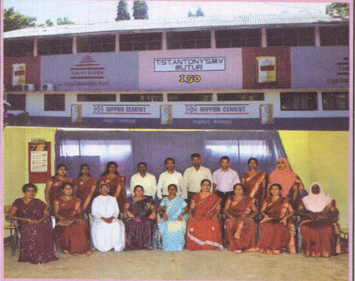
தொடர்ச்சி 4ம் பக்கம்