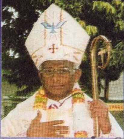
மெது மறைமாவட்ட ஆயர் ஆயர்த்துவ வாழ்வில் 30 வருடங்கள்