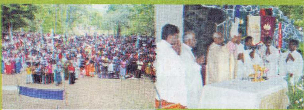
பாலையூற்று திருத்தலத் திருவிழா - 26.05.2013