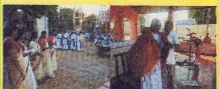
மறைமாவட்ட அன்பிய கொண்டாட்டம் உவார்மலைப் பங்கில் - 14.04.2013