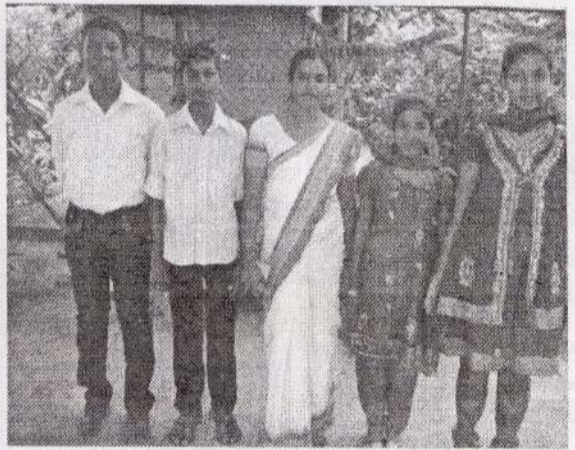
16 வயதாப் பீரீவு