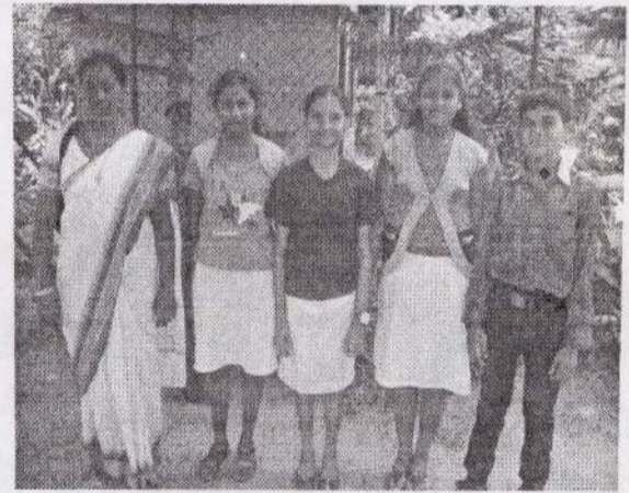
12 வயதாப் பீரீவு