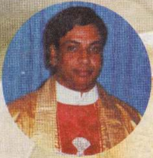
FR. B.A. யோசப் இறைபதம் அடைந்தார்