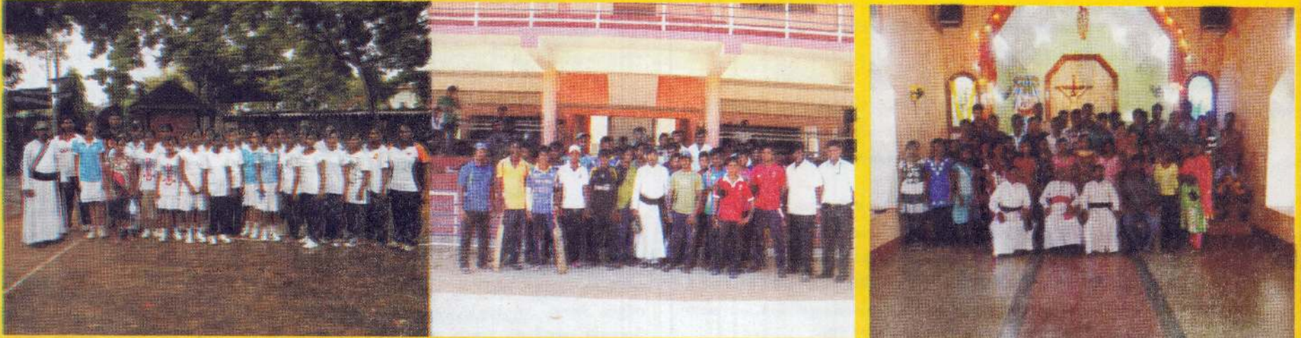
13.14 சித்திரை 2013 கிரிக்கட் சுற்றுப் போட்டியில் பேராலயம், குவாடலூப்பே ஒன்றியங்கள் முறையே 1ம், 2ம் இடங்களையும் வலைப்பந்தாட்டப் போட்டியில் குவாடலூப்பே, பேராலயம் முறையே 1ம், 2ம் இடங்களையும் பெற்றன.