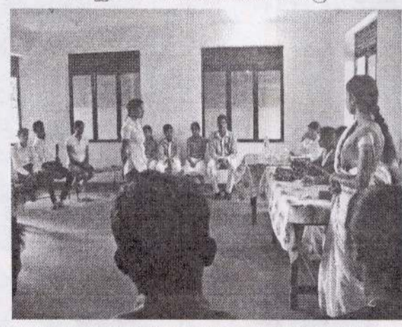
20 வயதாப் பீரீவு