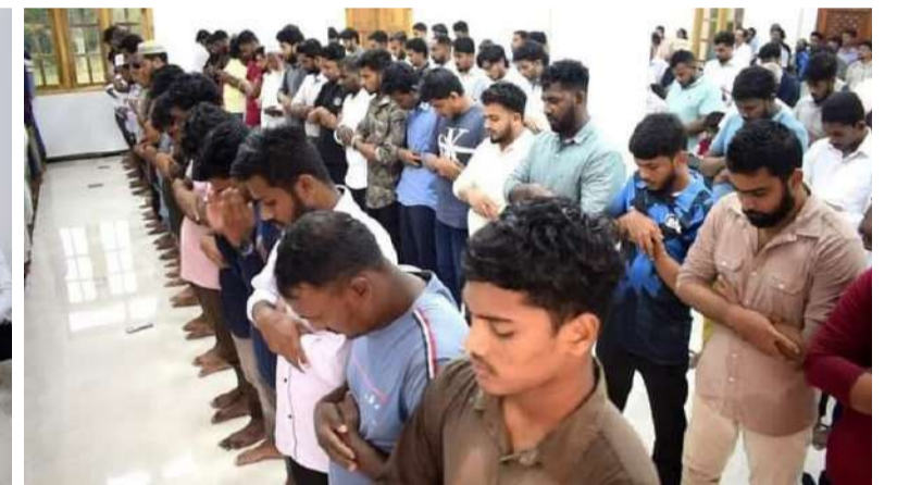
அனைத்து பீட பீடாதிபதிகளும் மூவின் மாணவர்களும் கலந்து சிறப்பித்தனர். நான்கு மதத்தினருக்கும் சரிசமமாக தலா 2 ஏக்கர் காணி, அவரவர் மத ஸ்தலங்களை அமைக்க யாழ்ப்பாண