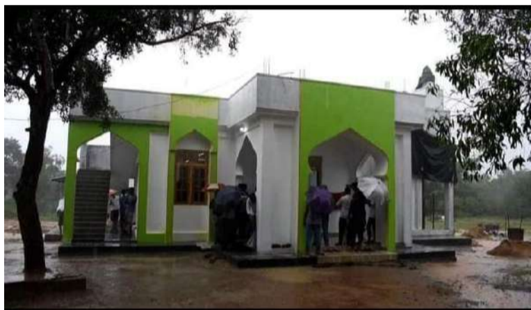
(யூட் இக்மால்) யாழ்ப்பாணம் பல்கலைக்கழகத்தின் கிளிநொச்சி