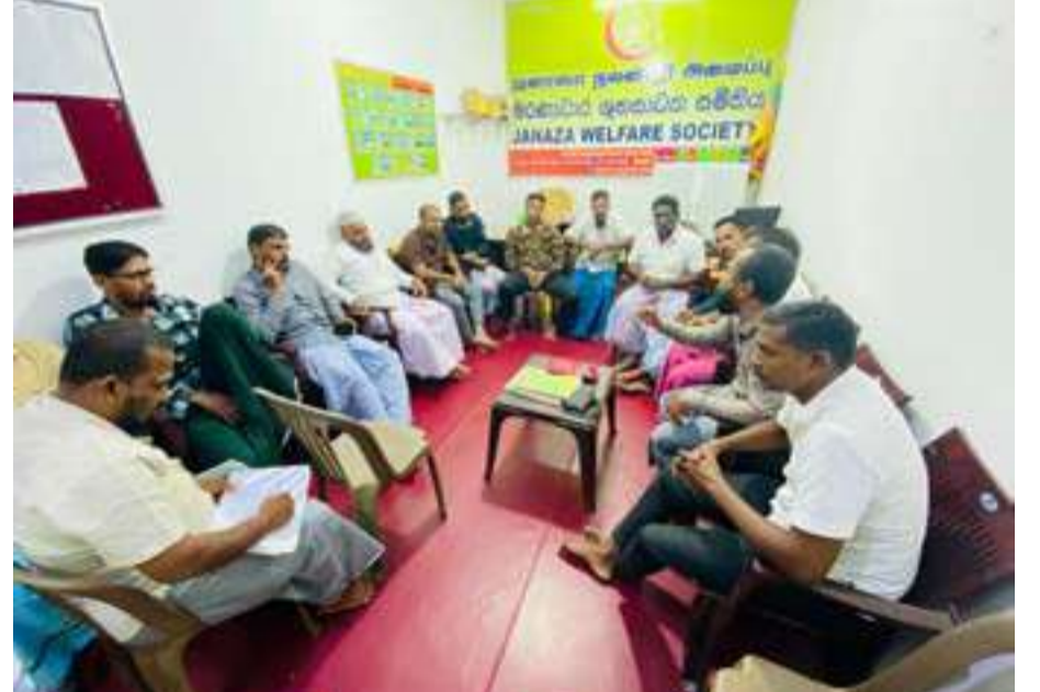
அனைத்து ஆயத்தங்களும் முன்னெடுக்கப்பட்டு தயார்

(எம்.பஹத் ஜீனாட்) அனர்த்த காலங்களில் காத்தான்குடி ஜனாஸா நலன்புரி அமைப்பு எவ்வாறு செயல்பட வேண்டும் என்பது தொடர்பாக ஆராயும் அவசர கூட்டம் சனிக்கிழமை (23) அமைப்பின் காரியாலயத்தில் நடைபெற்றது. இக் கூட்டத்தில் அவசர நிலைகள் மற்றும் அனர்த்தங்கள் ஏற்படும் போது பொதுமக்களுக்கு வழங்கப்பட வேண்டிய அவசர உதவிகள் மற்றும் பாதுகாப்புக்கள் தொடர்பாக விரிவாக கலந்துரையாடப்பட்டதுடன்