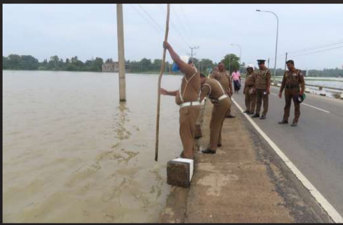
விஜயம் செய்து விபத்து குறித்த விசாரணைகளை உதவிப் பொலிஸ்

மாவடிப்பள்ளி அனர்த்தம் இடம்பெற்ற பகுதிக்கு