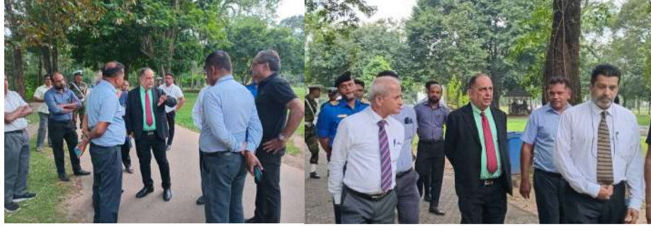
கொழும்பு விகாரமகாதேவி பூங்காவுக்கு மேல் மாகாண ஆளுநர் ஹனிப் யூசுப் அண்மையில் கள ஆய்வு விஜயம் மேற்கொண்டு பூங்காவின்