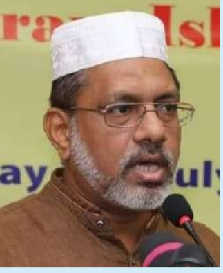
முஹம்மது பகீர் தீன்

என அலி (மு) அவர்கள் கூறுகிறார்கள். “மனிதர்கள் தங்கள் கைகளினால் எதைச் சம்பாதித்தார்களோ அதன் காரணமாக கடலிலும், தரையிலும் சீர்கேடுகளும் குழப்பமும் தோன்றி விட்டன. அவர்கள் திரும்பி வரவேண்டும் என்பதற்காக அவர்கள் செய்த சில செயல்களின் விளைவை கவனக்கும்படி அவன் செய்கிறான். (30:41)