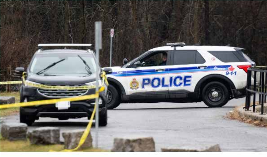
கனடாவில் வாயு கசிவு காரணமாக பத்து பேர் வைத்தியசாலையில் அனுமதிக்கப்பட்டுள்ளனர். ஓட்டாவாவின் வெனியர் மாவட்டத்

தின் கிரென்வில் பகுதியில் இந்த சம்பவம் இடம்பெற்றுள்ளது. கார்பன் மொனொக்ஸைட் வாயு கசிவு ஏற்பட்டிருக்கலாம் என சந்தேகம் வெளியிடப்பட்டுள்ளது.