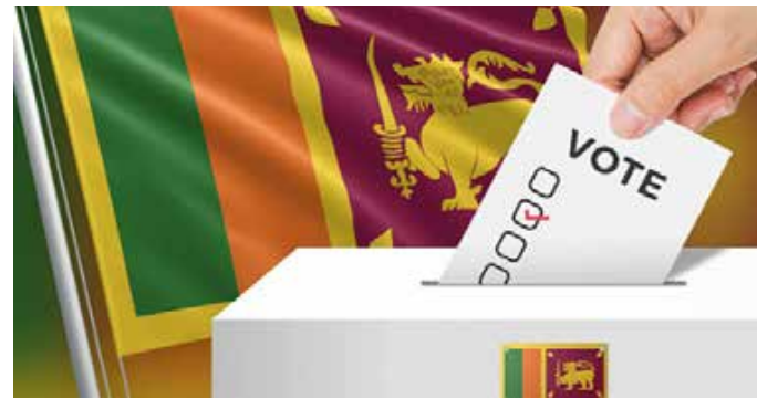
கொழும்பு, டிசெ 24

உள்ளூராட்சி மன்றத் தேர்தலுக்கான புதிய வேட்புமனுக்களை அழைப்பதற்கான புதிய வரைவுச் சட்டமூலத்திற்கு அமைச்சரவை அங்கீகாரம் வழங்கியுள்ளது.