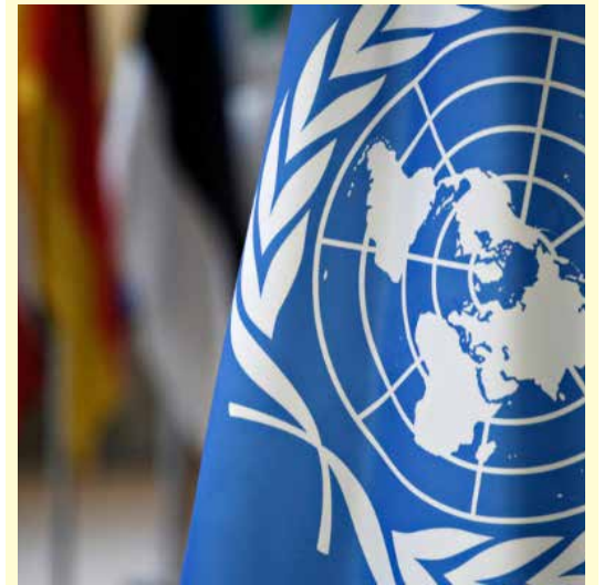
கொழும்பு, டிசெ 24

ஐக்கிய நாடுகளின் (ருே) பயிற்சி மற்றும் ஆராய்ச்சி நிறுவனத்தின் மூலம் இலங்கையின் இராஜதந்திரிகளுக்கு விசேட பயிற்சியளிக்கும் திட்டம் தொடர்பில், புரிந்துணர்வு ஒப்பந்தம் ஒன்றை கைச்சாத்திடுவதற்கு அமைச்சரவை அங்கீகாரம் வழங்கியுள்ளது.