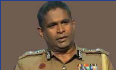
அதிபர், சட்டத்தரணி பிரியந்த வீரகூரிய தெரிவித்துள்ளார்.

மேற்படி விசாரணையை குற்றப்புலனாய்வு திணைக்களத்தின் ஊடாக முன்னெடுக்குமாறு பணிப்புரை வழங்கப்பட்டுள்ளதாக பதில் பொலிஸ் மா