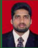
ம.பிரான்சிஸ்க், கத்தோலிக்க சுதந்திர பத்திரிகையாளர், தொடர்பாடல் ஆசிரியர்.

இங்கு நாம் எடுக்கும் 'கலக்கம்' மகா ஏரோது அரசன்