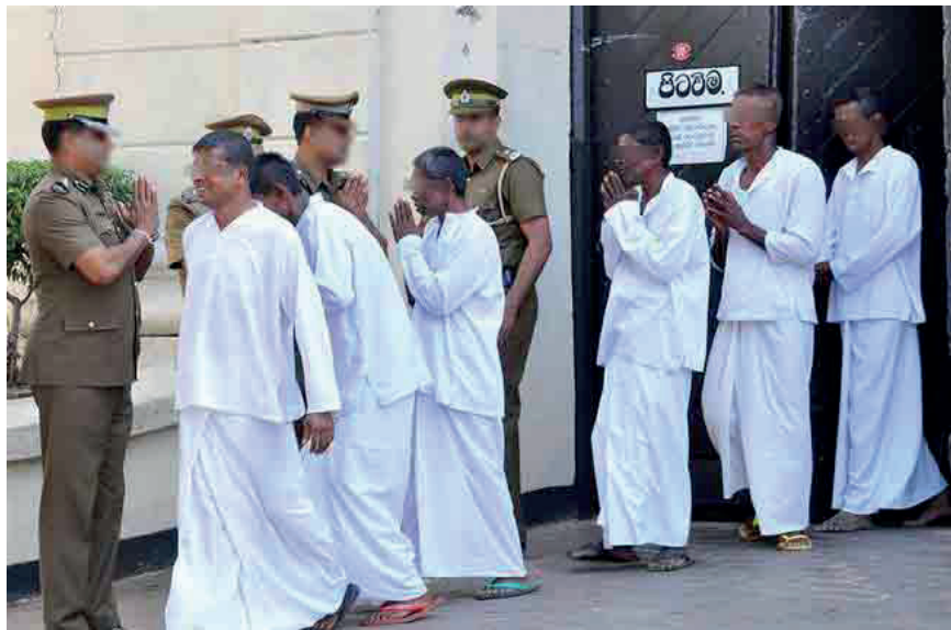
நத்தார் தினமான இன்று புதன்கிழமை (25) நாடளாவிய ரீதியில் சுமார் 389 கைதிகள் விசேட பொது மன்னிப்பின் கீழ் விடுவிக்கப்பட்டுள்ளதாக சிறைச்சாலைத் திணைக்களம் தெரிவித்துள்ளது. இவர்களில் நால்வர் பெண் கைதிகள் என்று தெரிவிக்கப்பட்டுள்ளது.