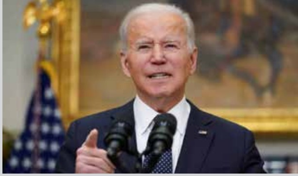
அதிகாரிகள் தெரிவித்தனர் இந்த நிலையில் இத்தாக்குதல் குறித்த ரஷ்யாவிடம் அமெரிக்கா அதிபர் ஜோபைடன் கண்டனம் தெரி

இதில் 59 ஏவுகணைகளையும் 54 டிரோன்களையும் உக்ரைன் வான்பாதுகாப்பு ஏவுகணைகள் இடைமறித்து அழித்தன. 52 டிரோன்கள் மின்னணு ஆயுதங்கள் மூலம் செயலிழக்கச் செய்யப்பட்டன என்று