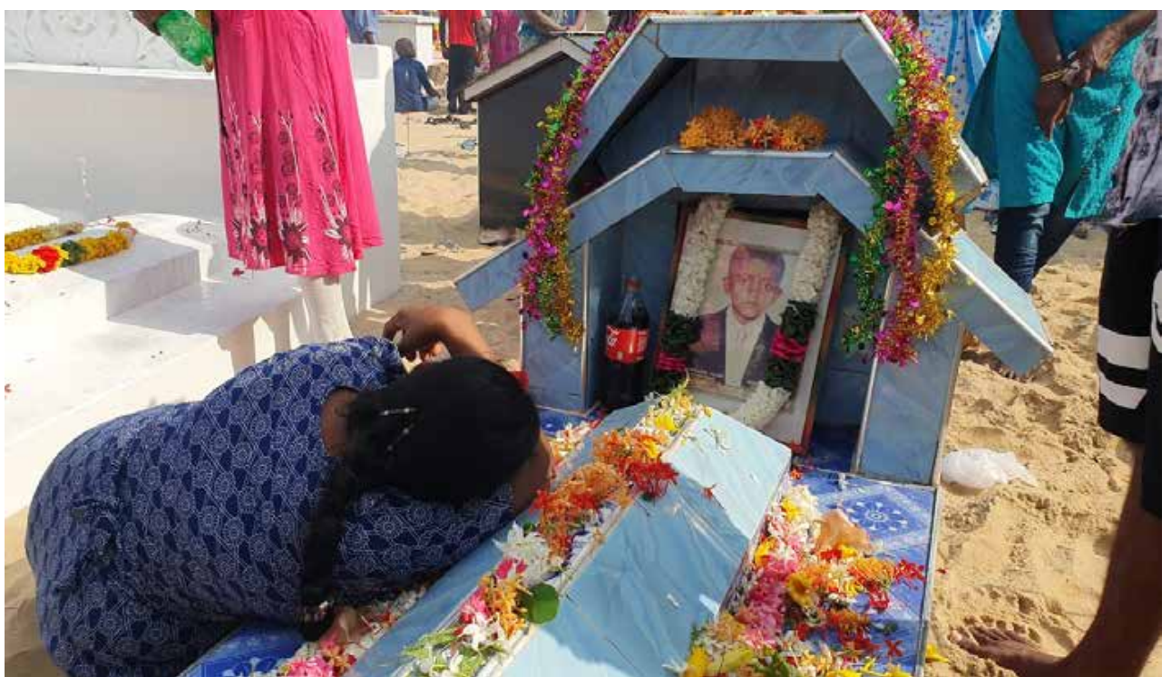
2004 ஆம் ஆண்டு மார்கழி மாதக் கடைசி வாரத்தில் உலகை உலுக்கிய சுனாமி - ஆழிப் பேரலை அனர்த்தத்தின் 20 ஆவது ஆண்டு நினைவு நாள் இன்றாகும். இதனையொட்டி யாழ்ப்பாணம் - உடுத்துறையில் அமைந்துள்ள சுனாமிப் பொது நினைவாலயத்தில் இடம்பெற்ற நினைவேந்தல் நிகழ்வில் தாயொருவர் கண்ணீர் மல்கக் கசிந்துருகும் காட்சி இது. மேலதிக படங்கள் 8 ஆம் பக்கத்தில்.