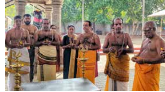
கலந்து கொண்டு மோட்ச வழிபாட்டில் ஈடுபட்டனர். (100)