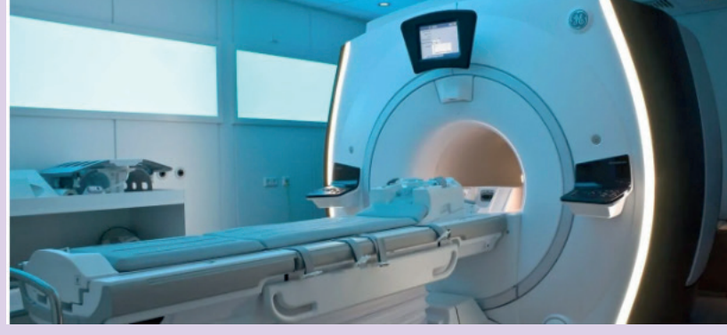
நடவடிக்கையினை மட்டுப்படுத்தப்பட்டமையால் இந்த நிலைமை ஏற்பட்டதாக அவர் கூறியுள்ளார்.