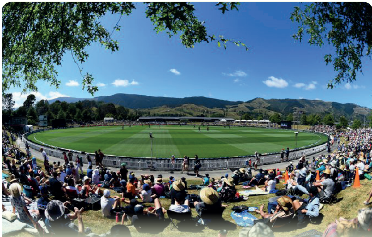
நியூசிலாந்து எதிர் இலங்கை:

இந்நிலையில், அல்லு அர்ஜூனின் தந்தையும் தயாரிப்பாளருமான அல்லு அரவிந்த், புத்தகிழமை (25) காயமடைந்த சிறுவன் சிகிச்சை பெற்றுவரும் ஹைதராபாத் கிம்ஸ் வைத்தியசாலைக்குச் சென்று நலம் விசாரித்துள்ளார். அத்துடன், அல்லு அர்ஜூன் தரப்பில் 1 கோடி ரூபாய், புஷ்பா திரைப்பட இயக்குநர் சுகுமார் சார்பில் 50 இலட்சம் ரூபாய், தயாரிப்பு நிறுவனமான மைத்ரி மூவீஸ் சார்பில் 50 இலட்சம் ரூபாய் என 2 கோடி ரூபாய்க்கான காசோலையை, காயமடைந்த சிறுவனின் தந்தையிடம் அல்லு அர்ஜூன் வழங்கியுள்ளதாக தெரிவிக்கப்படுகின்றது.