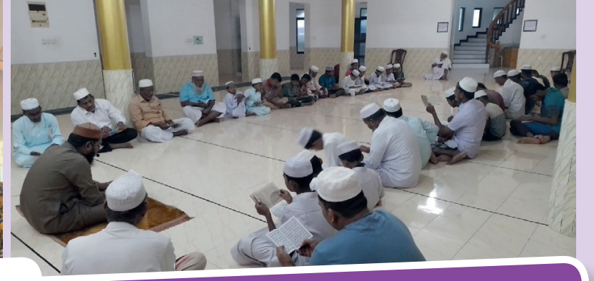
சுனாமி பேரலை காவுகொண்டவர்களுக்காக