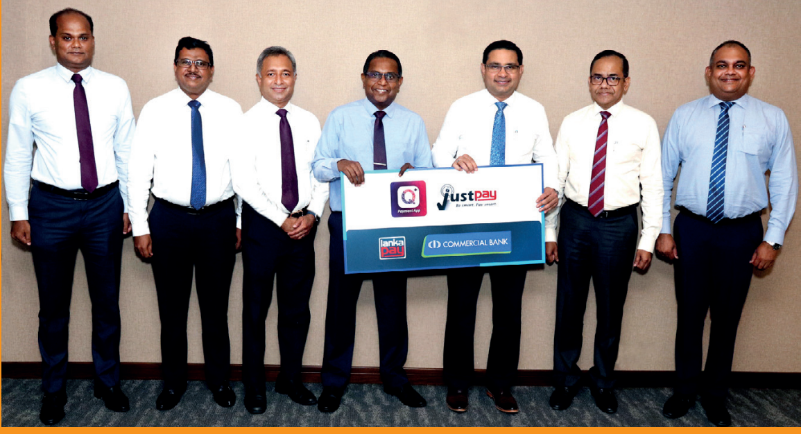
JustPay மூலம் கொமர்ஷல் வங்கியின்