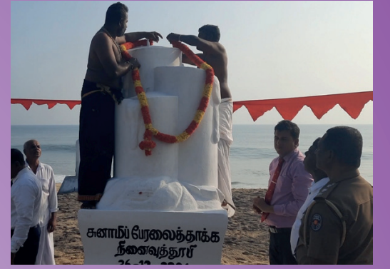
சுனாமி பேரலைத்தாக்க நினைவுத்தூபி