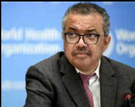
இந்நிலையில் கைது செய்யப்பட்ட ஐ.நா உழியர்களை விடுவிப்பது தொடர்பாகப் பேச்சுவார்த்தை நடத்தவும், ஏமனில் சுகாதார மற்றும் மனிதாபிமான

பாலஸ்தீனம் மீது நடத்திவரும் தாக்குதலைக் கண்டித்து ஏமனில் செயல்பட்டு வரும் ஹவுதி கிளர்ச்சியாளர்கள் இஸ்ரேல் மீது தாக்குதல் நடத்தி வருகின்றனர்.