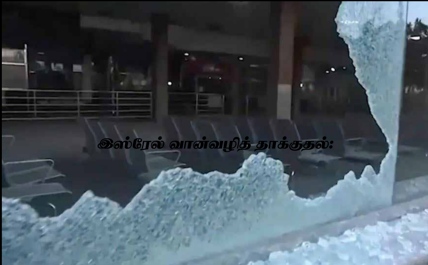
இஸ்ரேல் வான்வழித் தாக்குதல்: